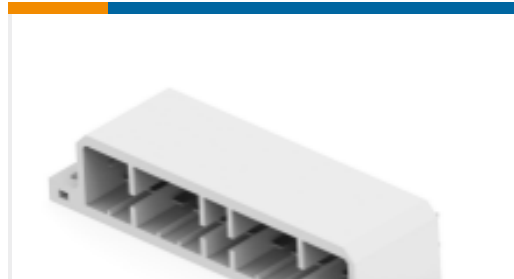
TE 产品编号171457-1 MIC CAP 21P V