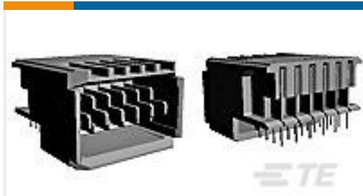
TE 产品编号5646956-2 UPM PIN ASSEMBLY, SEQUENCED