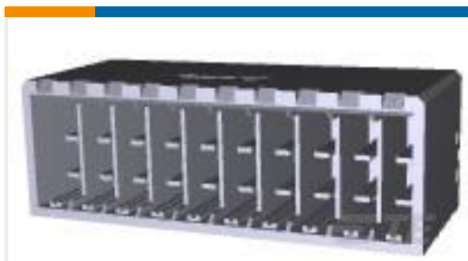
TE 产品编号316517-2 DYNAMIC 3500 HDR ASSY 20P V