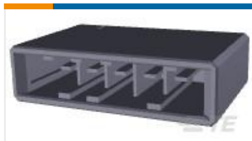
TE 产品编号1-316132-2 DYNAMIC D-3200 HDR ASSY 5P V