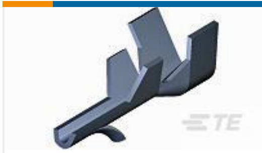
TE 产品编号925819-3 MINI AMP-IN 26-22 AWG