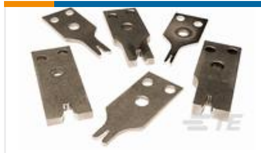
TE 产品编号1-1633996-5 CRIMPER, INSULATION SPECIAL