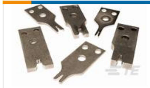
TE 产品编号1-1673600-0 CRIMPER, WIRE (.050" 'F')