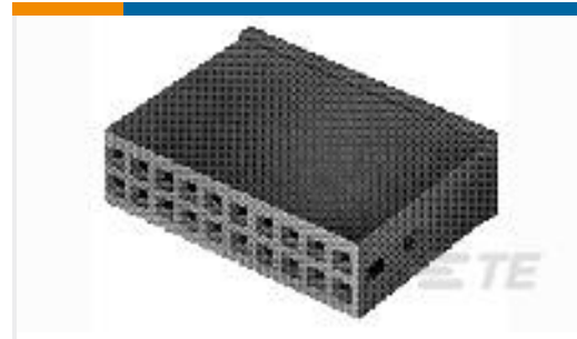
TE 产品编号1-925369-2 MOD 4 REC.HSG 1X12P