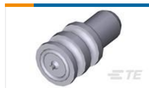
TE 产品编号963531-1 BLINDSTOPFEN