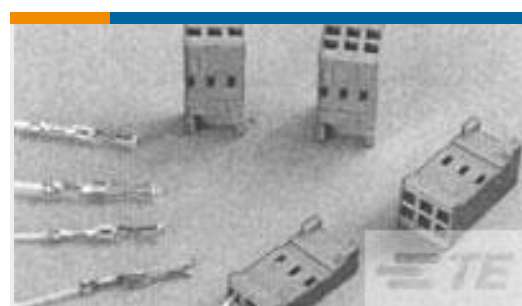
TE 产品编号188746-1 CONTACT REC HE13 COSI GOLD PLATED