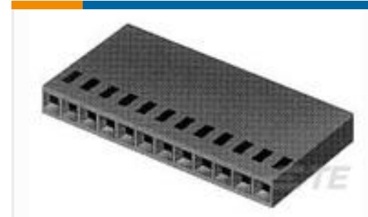
TE 产品编号87499-8 04 MODIV HSG COMP SR .100CL