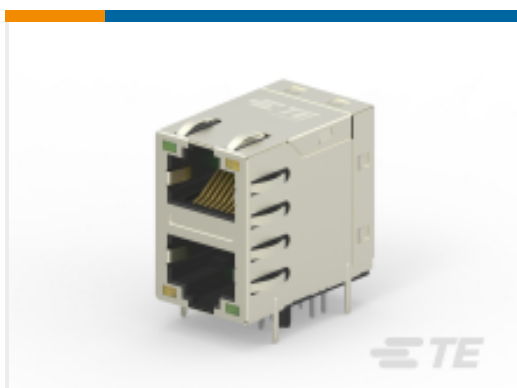
TE 产品编号2301997-9 RJ45 JACK INT.MAG. 10/100 LED 2X1