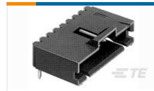
TE 产品编号5-103634-9 10 MTE HDR SRRA LTCH.100CL LF