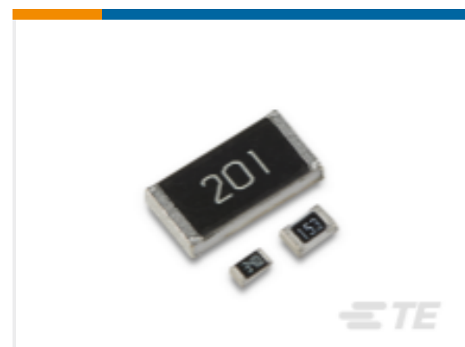
TE 产品编号2-2176326-2 CRGP 0603 560R 1%