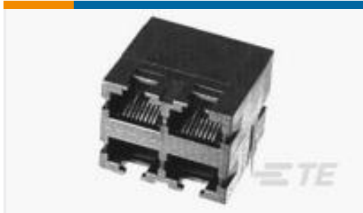
TE 产品编号2041376-2 RJ45 W LED 2X2,30u",DIP,H=25.4mm