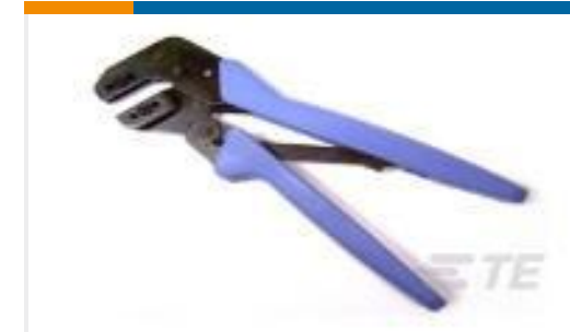
TE 产品编号90548-1 ASSY PRO-CRIMPER UNIV M-N-L