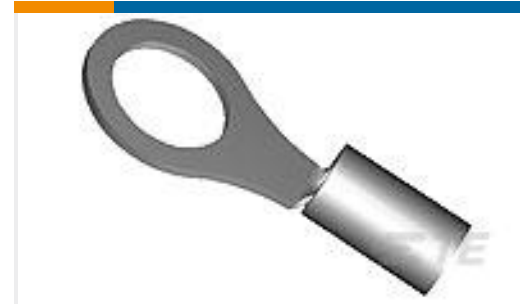
TE 产品编号321890 TERMINAL,SOLIS R HT 22-16 8