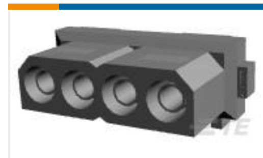
TE 产品编号770997-1 04P CMNL SOK HDR ASSY