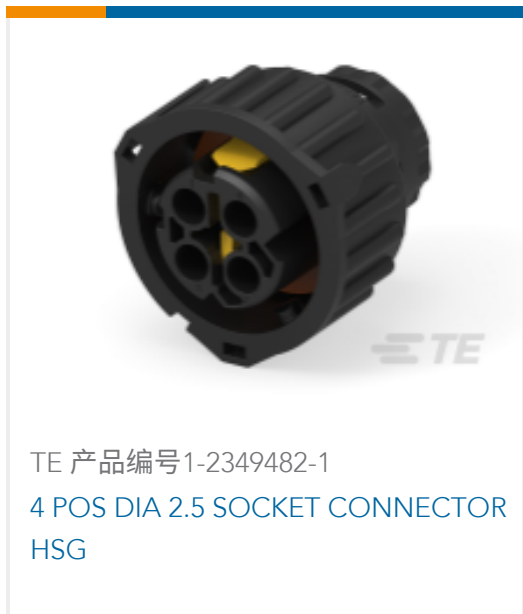
TE 产品编号1-2349482-1 4 POS DIA 2.5 SOCKET CONNECTOR HSG