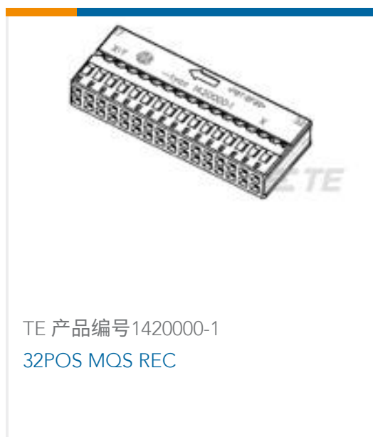
TE 产品编号1420000-1 32POS MQS REC