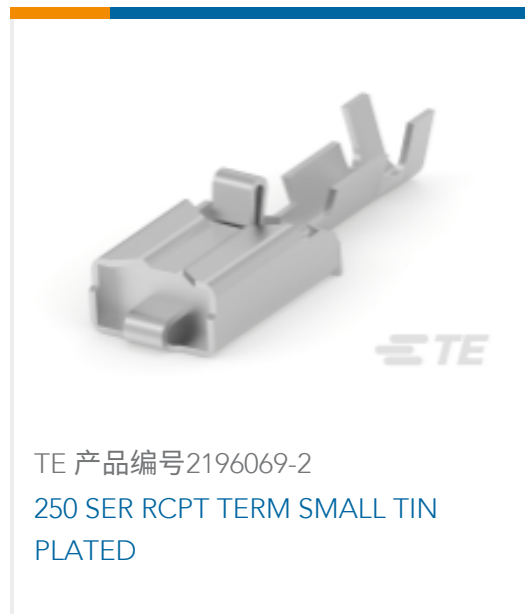
TE 产品编号2196069-2 250 SER RCPT TERM SMALL TIN PLATED