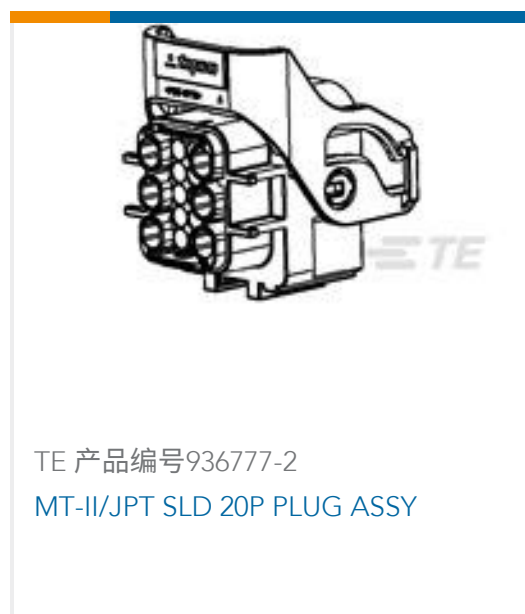
TE 产品编号936777-2 MT-II/JPT SLD 20P PLUG ASSY