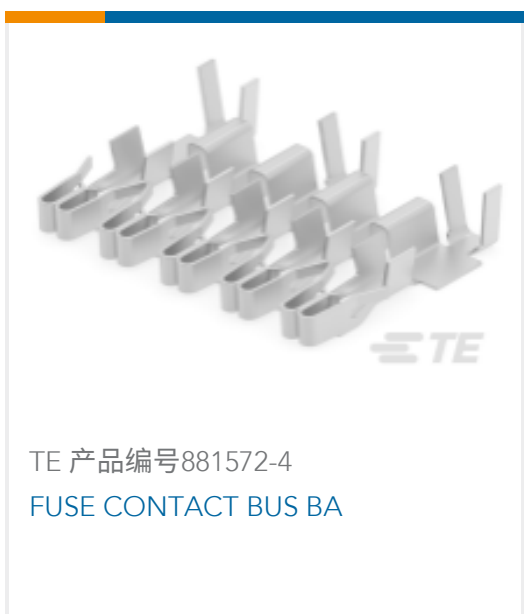
TE 产品编号881572-4 FUSE CONTACT BUS BA