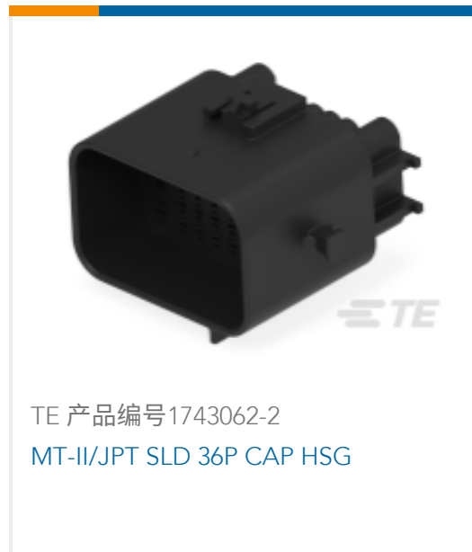
TE 产品编号1743062-2 MT-II/JPT SLD 36P CAP HSG