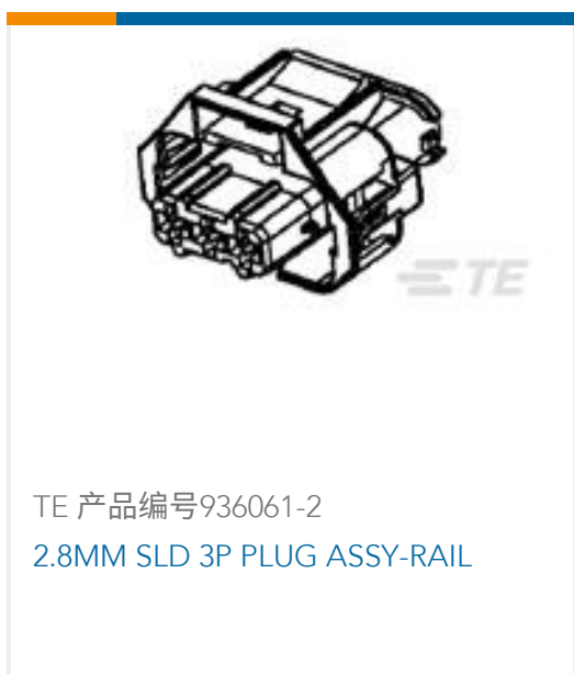
TE 产品编号936061-2 2.8MM SLD 3P PLUG ASSY-RAIL