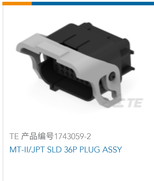
TE 产品编号1743059-2 MT-II/JPT SLD 36P PLUG ASSY