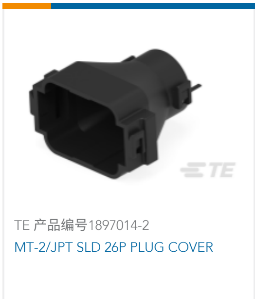
TE 产品编号1897014-2 MT-2/JPT SLD 26P PLUG COVER HSG