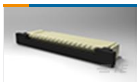
TE 产品编号 2-84953-3 1MM FPC HORZ.TOP CONT.ASSY 23P