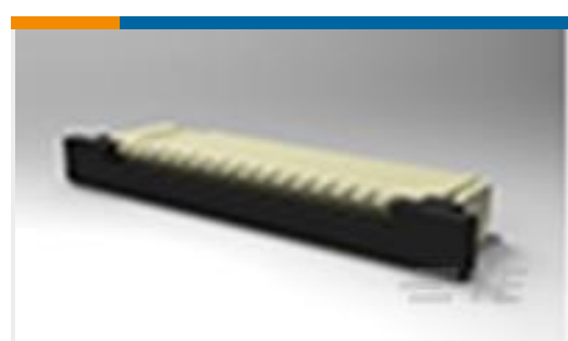
TE 产品编号 2-84953-1 1MM FPC HORZ.TOP CONT.ASSY 21P