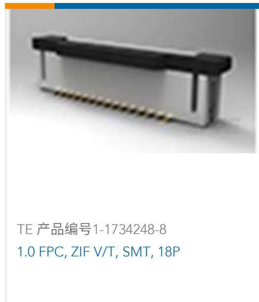
TE 产品编号1-1734248-8 1.0 FPC, ZIF V/T, SMT, 18P