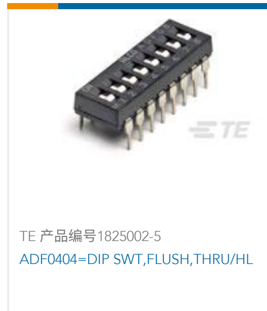
TE 产品编号1825002-5 ADF0404=DIP SWT,FLUSH,THRU/HL