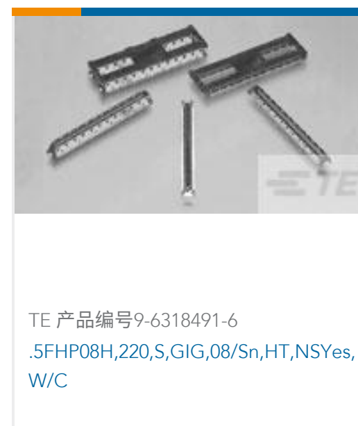
TE 产品编号9-6318491-6 .5FHP08H,220,S,GIG,08/Sn,HT,NSYes, W/C