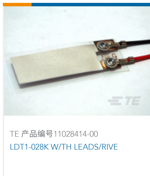
TE 产品编号11028414-00 LDT1-028K W/TH LEADS/RIVE