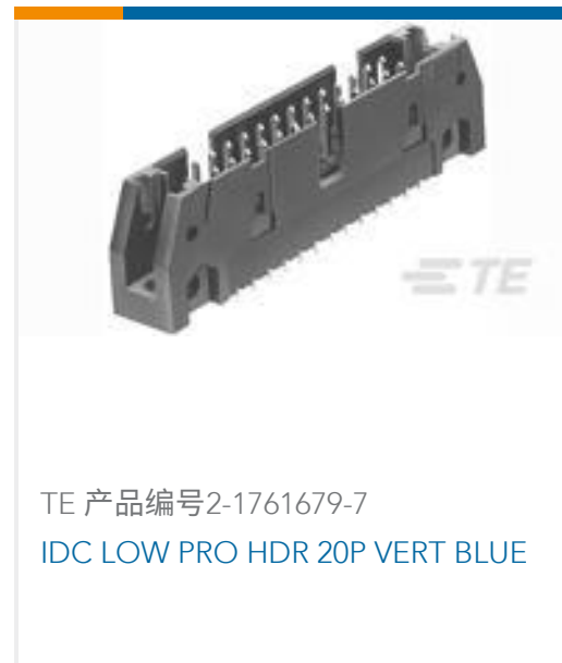
TE 产品编号2-1761679-7 IDC LOW PRO HDR 20P VERT BLUE