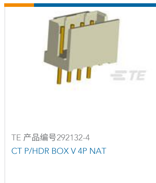
TE 产品编号292132-4 CT P/HDR BOX V 4P NAT