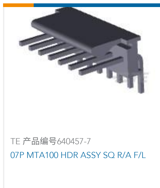
TE 产品编号640457-7 07P MTA100 HDR ASSY SQ R/A F/L