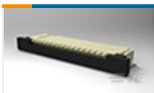
TE 产品编号 2-84953-0 1MM FPC HORZ.TOP CONT.ASSY 20P