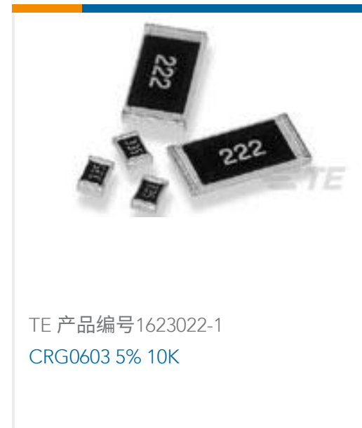
TE 产品编号1623022-1 CRG0603 5% 10K