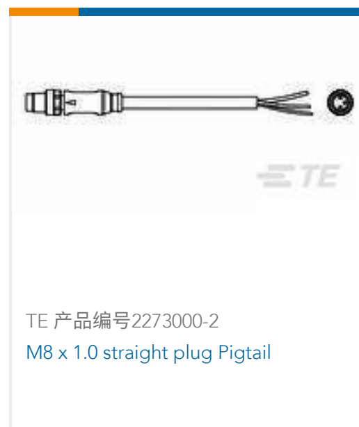
TE 产品编号2273000-2 M8 x 1.0 straight plug Pigtail