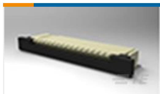
TE 产品编号 2-84953-2 1MM FPC HORZ.TOP CONT.ASSY 22P