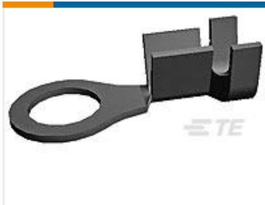
TE 产品编号170225-1 RING TERMINAL