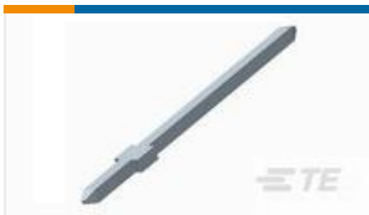
TE 产品编号1-928836-2 MOD2 PIN WITH A-PIN L/P