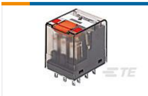
TE 产品编号3-1415020-1 PT570N20