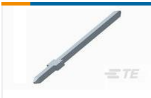
TE 产品编号1-928836-2 MOD2 PIN WITH A-PIN L/P