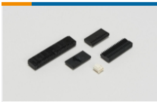
线到板连接器组件和护套(5)