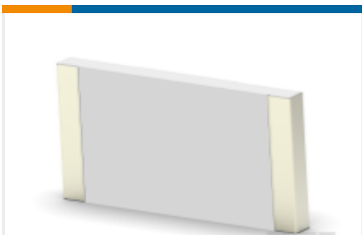
TE 产品编号7-2176246-6 CRGS2512 5% 1M8