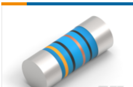
TE 产品编号2176314-4 MELF SMA_A 180R 0.1% 15PPM 0102 0.3W