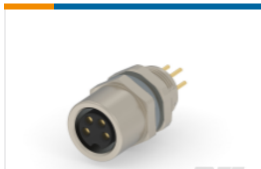
TE 产品编号T4043014041-000 M8.FMLE.PNLFRONT.4POS.STRPCB