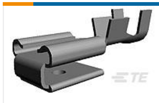
TE 产品编号60279-2 250 FASTON REC 18-14 AWG TPBR