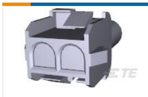
TE 产品编号1-480699-9 02P UMNL CAP HSG BLK