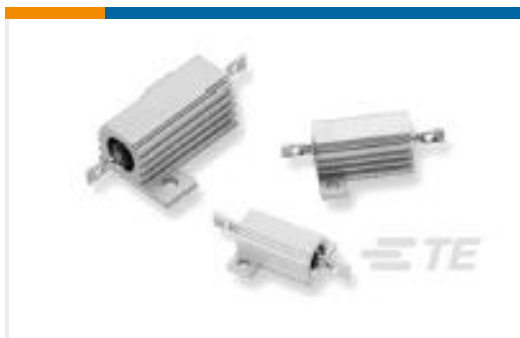
TE 产品编号2-1879074-3 THS15 50R 5%