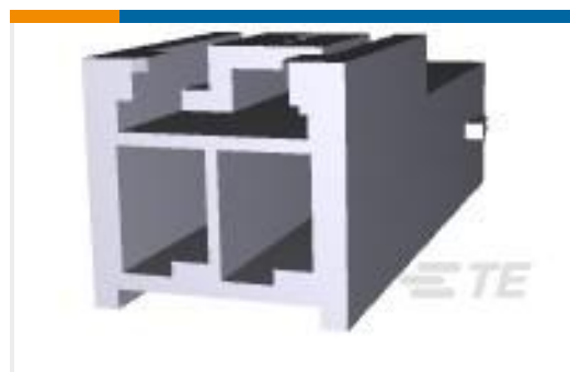
TE 产品编号179463-1 POWER DBL LOCK CAP HSG F/H 2P