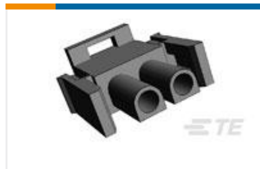
TE 产品编号1-480698-9 02P UMNL PLUG HSG BLK