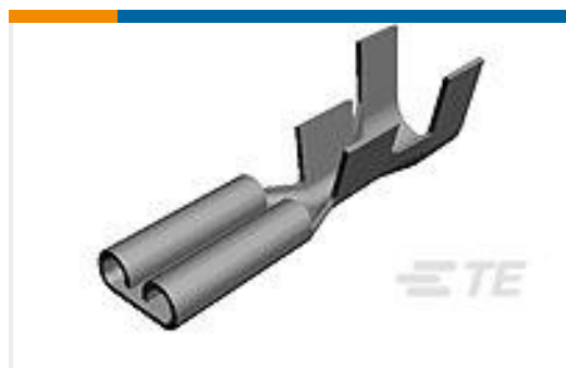
TE 产品编号63705-1 125 FASTON REC 22-18 AWG BR