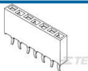
TE 产品编号 2-215299-0 20P HV100 REC CON. TE, 8.5MM