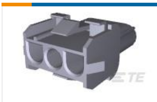
TE 产品编号1-480701-9 03P UMNL CAP HSG BLK