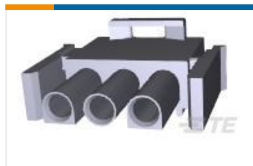
TE 产品编号1-480700-9 03P UMNL PLUG HSG BLK