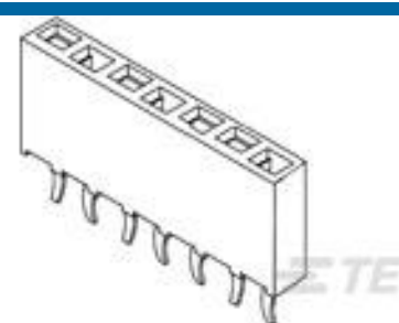
TE 产品编号 2-215297-0 20P HV100 REC CON. TE, 7.0MM