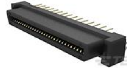
TE 产品编号3-5175475-5 CHAMP 050 B/B REC V W/LEG 40P