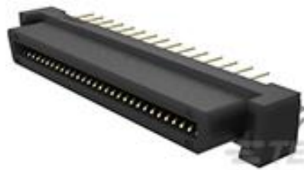
TE 产品编号3-5175475-7 CHAMP 050 B/B REC V W/LEG 60P