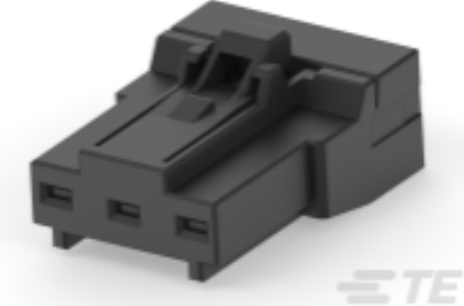
TE 产品编号3-2134249-3 D3900S 7.5MM PITCH REC ASSY 3P BLACK Z