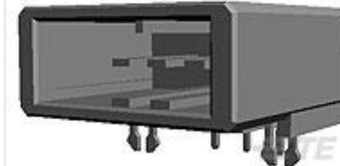
TE 产品编号2-2013519-0 DYNAMIC D3900 H-HDR ASSY 10P Y TYPE-A