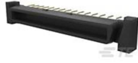
TE 产品编号5917629-5 AMP FH REC V 120P H-9 SIF