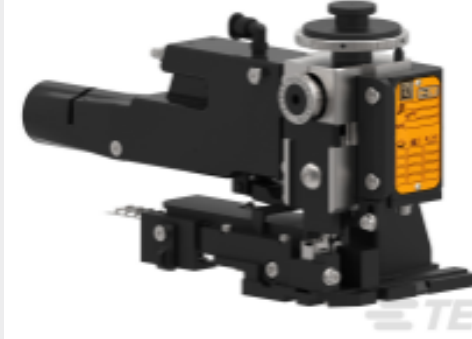
TE 产品编号2837892-2 OCEAN-2.0-APPLICATOR-S-046F053F- SSA