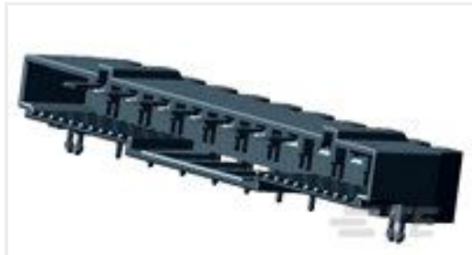
TE 产品编号1-2229803-2 D3950 HDR 7/11POS 1ROW Y KEY