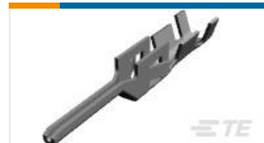
TE 产品编号1-794612-1 PIN CONT 20-24 15 GOLD L/P