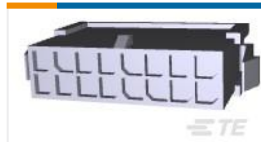
TE 产品编号1-794615-6 PANEL MT DBL ROW HSG 16 POS