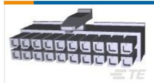
TE 产品编号2-794617-0 20POS,MICRO MNL,RCPT HSG