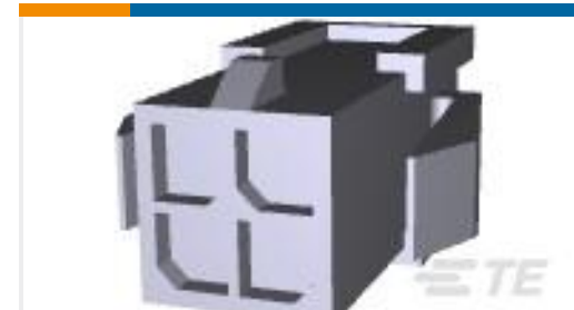
TE 产品编号794615-4 PANEL MT DBL ROW HSG 4 POS