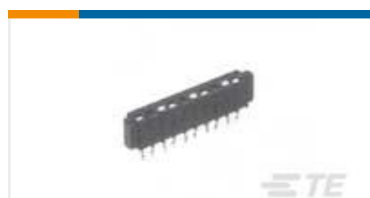
TE 产品编号5-520315-4 TRIOMATE ASSY V 4P L=3.556LDFR