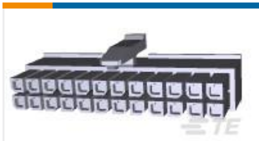
TE 产品编号2-794617-4 24POS,MICRO MNL,RCPT HSG