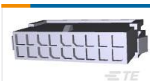
TE 产品编号1-794615-8 PANEL MT DBL ROW HSG 18 POS