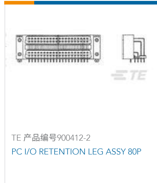
TE 产品编号900412-2 PC I/O RETENTION LEG ASSY 80P