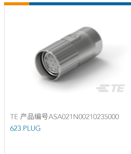
TE 产品编号ASA021N00210235000 623 PLUG