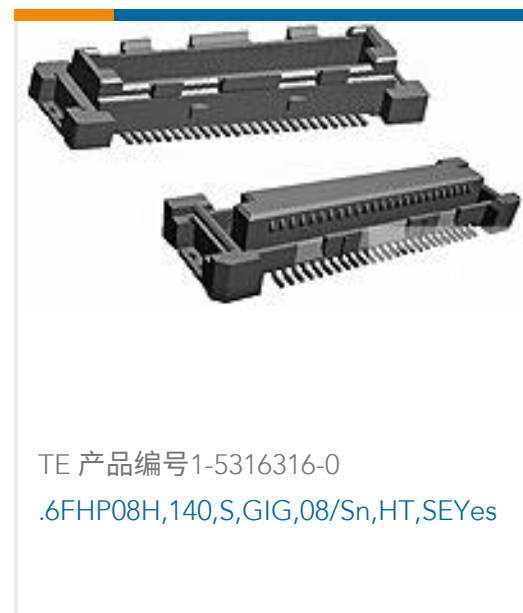
TE 产品编号1-5316316-0 .6FHP08H,140,S,GIG,08/Sn,HT,SEYes