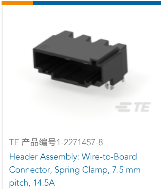
TE 产品编号1-2271457-8 Header Assembly: Wire-to-Board Connector, Spring Clamp, 7.5 mm pitch, 14.5A