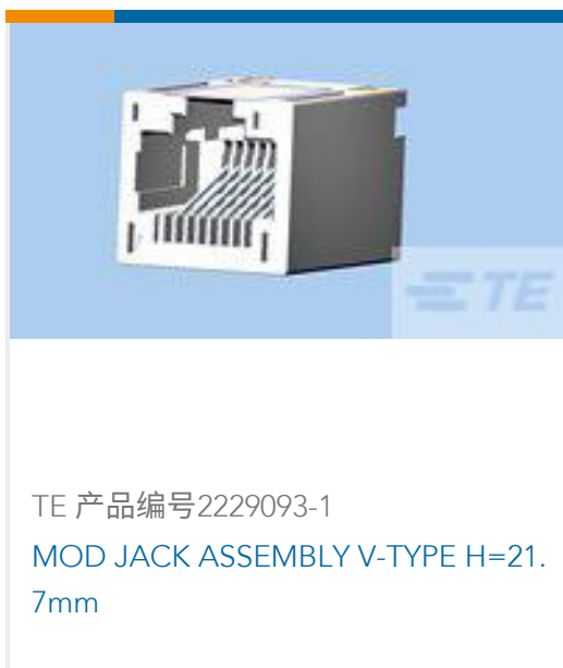
TE 产品编号2229093-1 MOD JACK ASSEMBLY V-TYPE H=21. 7mm