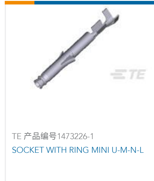
TE 产品编号1473226-1 SOCKET WITH RING MINI U-M-N-L