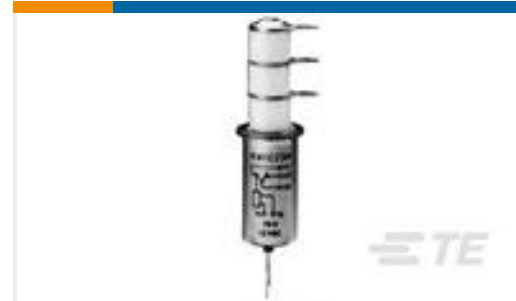
TE 产品编号5-1618239-0 K41C334=RELAY, VACUUM, SPDT