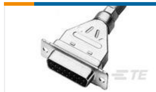
TE 产品编号5747539-1 KIT, RCPT, 15P, HDP-20, SHLD HDWRE