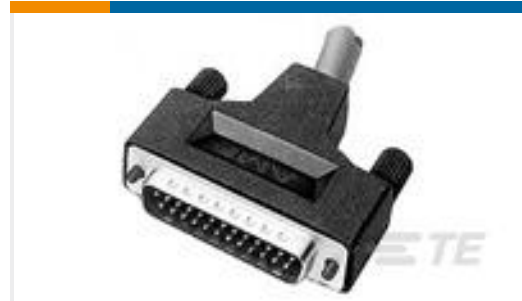
TE 产品编号1-747944-5 09 SHLDG ENCL PLUG, LEAD FREE