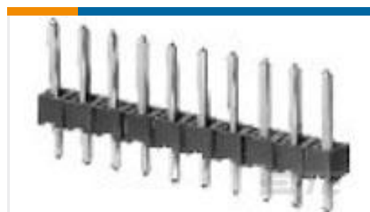
TE 产品编号9-146285-0 40 MODII HDR SRST B/A .100CL