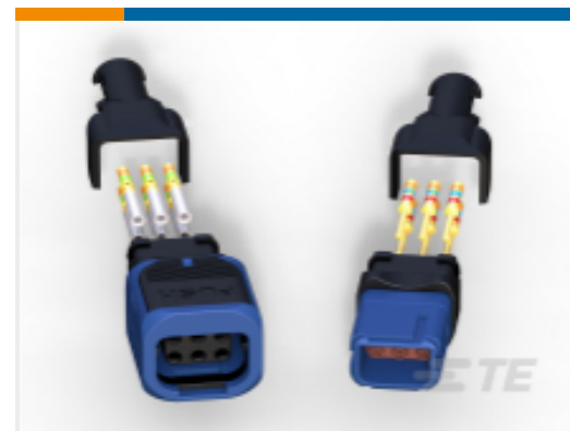
TE 产品编号YD369-P33-BS000000 369 3 WAY PLUG, NO CONTACTS, SKT