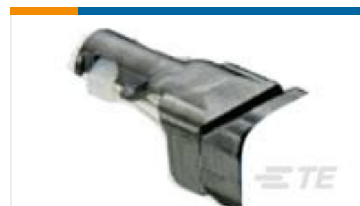
TE 产品编号D369-STB-3 369 3 WAY BACKSHELL STRAIGHT TIE WRAP