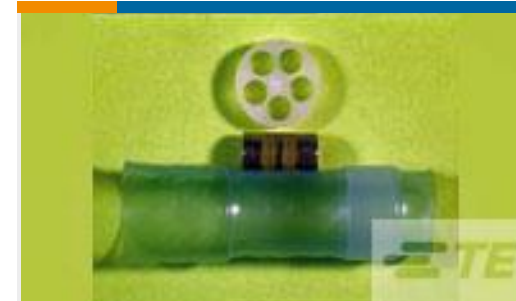
TE 产品编号650139-000 D-436-52