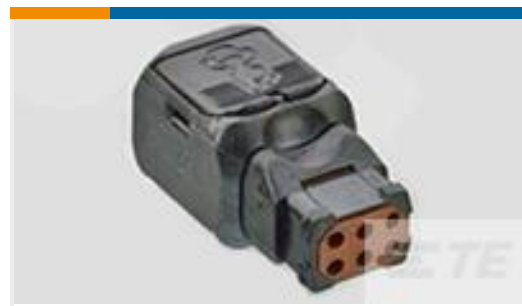
TE 产品编号D369-R66-BS0 369 6 WAY REC, NO CONTACTS, SKT