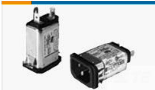
TE 产品编号1-6609005-3 6EBS1=F7405N S0