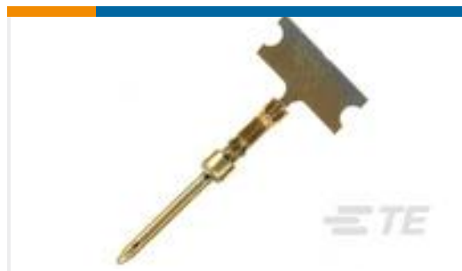
TE 产品编号66507-4 HD 20 DF PIN PLTD