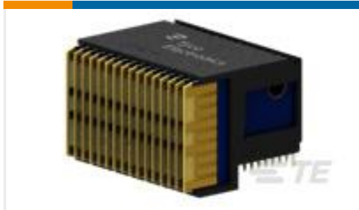
TE 产品编号2102847-1 DC, 7Row, Center, MULTIGIG RT 2R