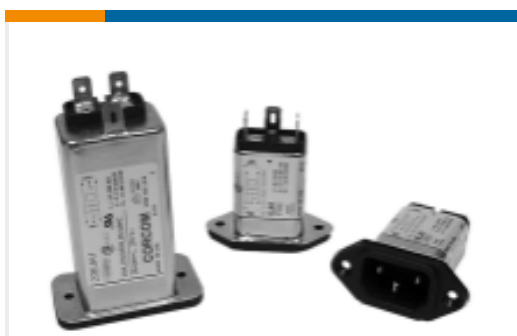
TE 产品编号6609008-5 IEC Filtered Inlets, Corcom EJH Series