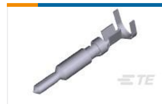
TE 产品编号770248-1 UMNL II PIN PTPBR LP 20-14AWG