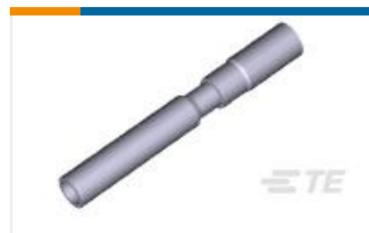
TE 产品编号193842-1 SKT ASSY., 2MM, 12-14 AWG