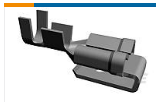
TE 产品编号1217151-1 187 FASTON, PIGGYBACK REC., 18-14 AWG, TPBR