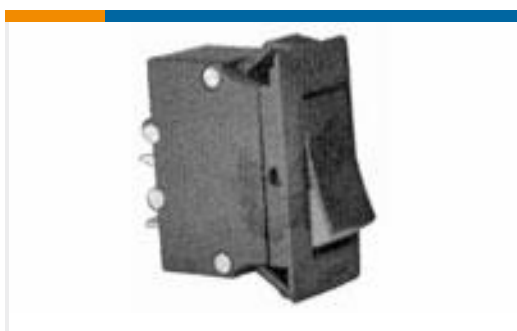
TE 产品编号1423673-6 W51-A121B1-15=CKTBKR, THERM, ROC