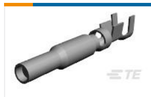
TE 产品编号770251-3 UMNL II SOK PTPPHBZ LP 20-14