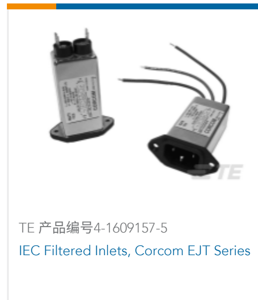
TE 产品编号4-1609157-5 IEC Filtered Inlets, Corcom EJT Series