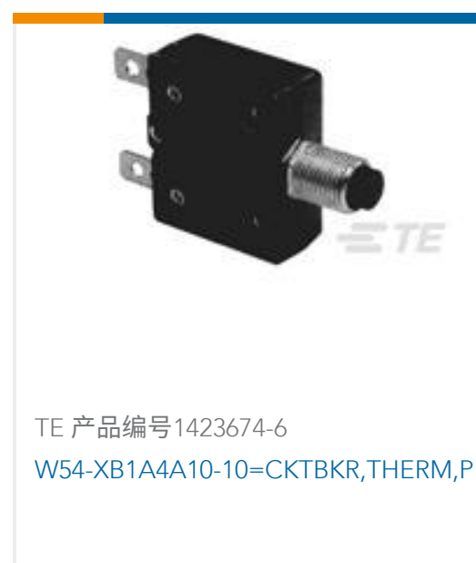
TE 产品编号1423674-6 W54-XB1A4A10-10=CKTBKR, THERM, P