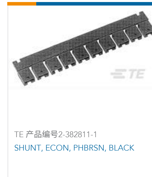
TE 产品编号2-382811-1 SHUNT, ECON, PHBRNS, BLACK