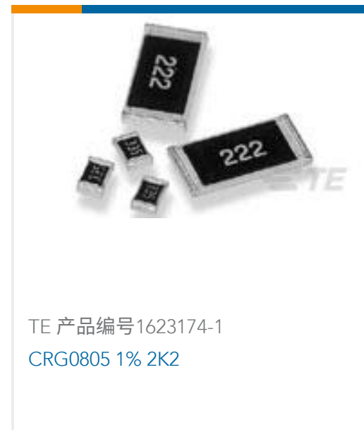
TE 产品编号1623174-1 CRG0805 1% 2K2