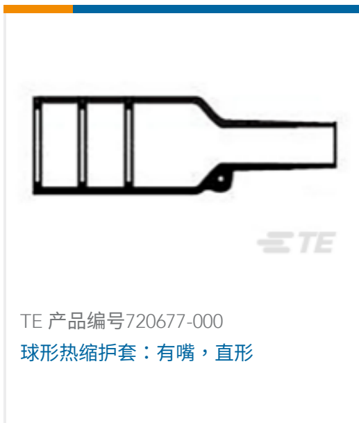
TE 产品编号720677-000 球形热缩护套：有嘴，直形