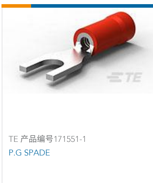
TE 产品编号171551-1 P.G SPADE