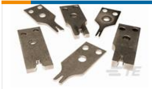
TE 产品编号7-2119784-6 CRIMPER INSULATION O PREMIUM