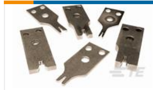
TE 产品编号1333291-2 CRIMPER, INSULATION,SPECIAL (.173")