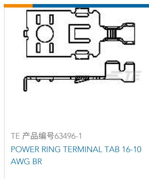
TE 产品编号63496-1 POWER RING TERMINAL TAB 16-10 AWG BR