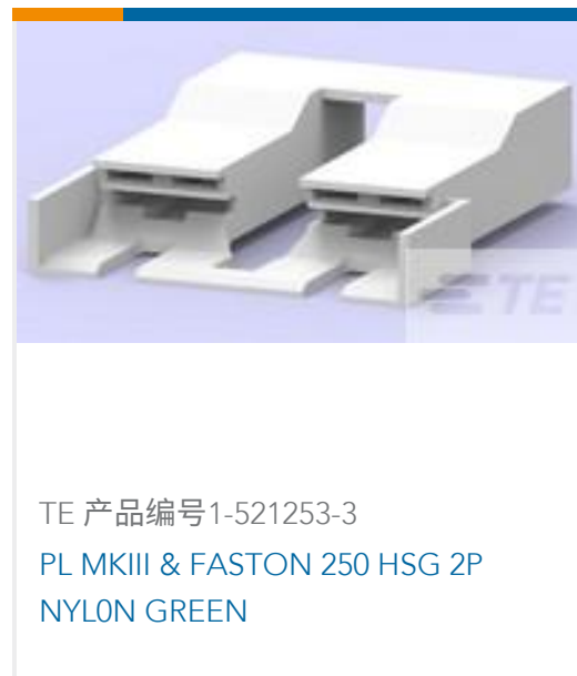
TE 产品编号1-521253-3 PL MKIII & FASTON 250 HSG 2P NYLON GREEN