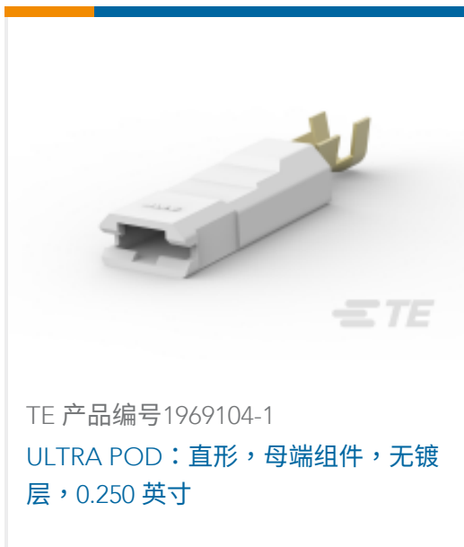
TE 产品编号1969104-1 ULTRA POD：直形，母端组件，无镀层，0.250 英寸