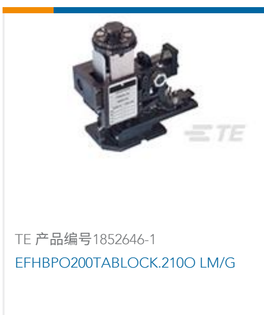
TE 产品编号1852646-1 EFHBPO200TABLOCK.2100 LM/G