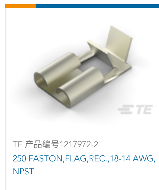
TE 产品编号1217972-2 250 FASTON, FLAG, REC., 18-14 AWG, NPST