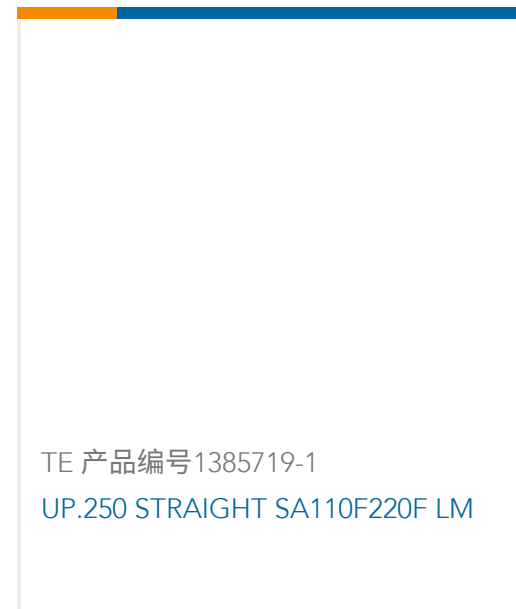
TE 产品编号1385719-1 UP.250 STRAIGHT SA110F220F LM