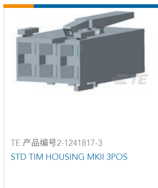
TE 产品编号2-1241817-3 STD TIM HOUSING MKII 3POS