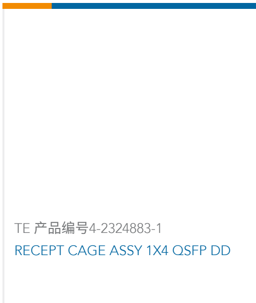
TE 产品编号4-2324883-1 RECEPT CAGE ASSY 1X4 QSFP DD