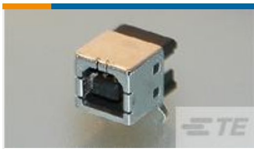
TE 产品编号292304-1 STD USB TYPE B, R/A, T/H