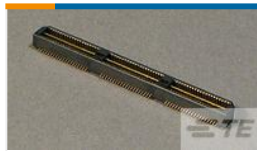
TE 产品编号7-1658013-3 MSB0.80PL5ASY84DP,GP,10,VCTR