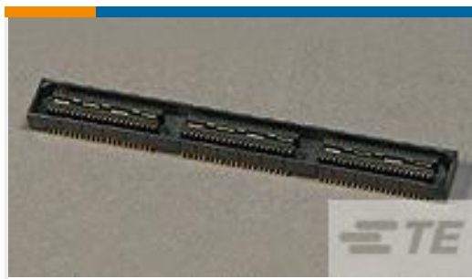
TE 产品编号7-1658012-3 MSB0.80RC-ASY84DP,-,10,VCTR