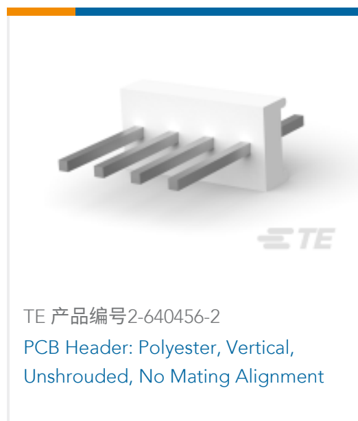
TE 产品编号2-640456-2 PCB Header: Polyester, Vertical, Unshrouded, No Mating Alignment