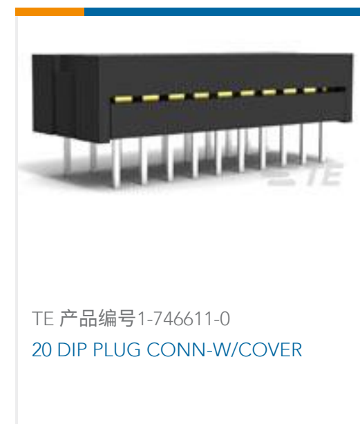
TE 产品编号1-746611-0 20 DIP PLUG CONN-W/COVER