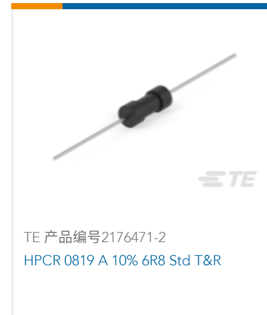
TE 产品编号2176471-2 HPCR 0819 A 10% 6R8 Std T&R