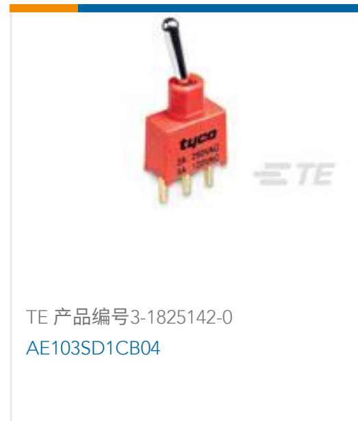
TE 产品编号3-1825142-0 AE103SD1CB04