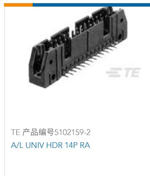
TE 产品编号5102159-2 A/L UNIV HDR 14P RA