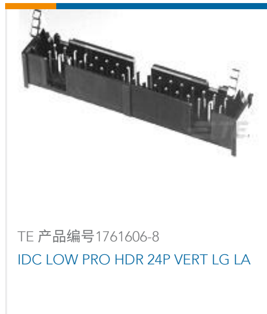
TE 产品编号1761606-8 IDC LOW PRO HDR 24P VERT LG LA