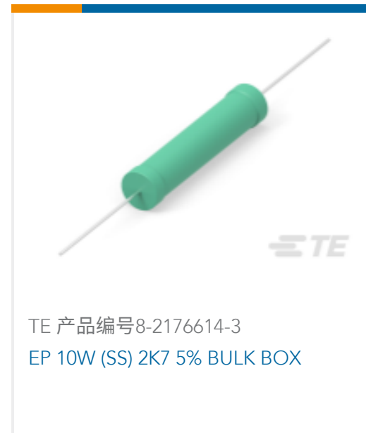
TE 产品编号8-2176614-3 EP 10W (SS) 2K7 5% BULK BOX