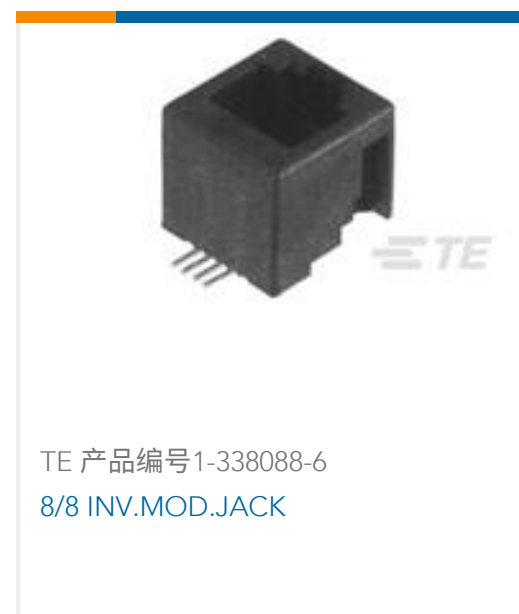
TE 产品编号1-338088-6 8/8 INV.MOD.JACK