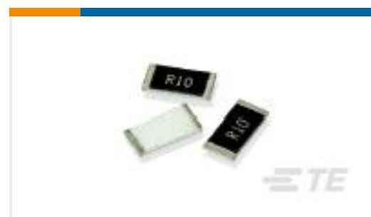
TE 产品编号1-2176058-9 RLP73N 3A R056 5% 2K RL