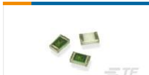
TE 产品编号1676366-2 RN 0805 51R1 0.1% 10PPM 1KRL