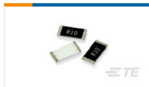
TE 产品编号2-2176058-9 RLP73K 3A R15 5% 2K RL