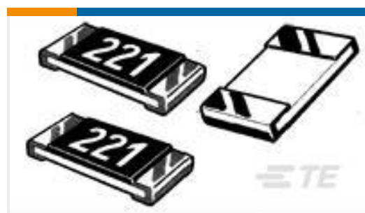
TE 产品编号9-2176070-5 3521 82K 1% 2W