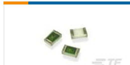
TE 产品编号5-2176089-3 RP 1J 0.166W 39K2 0.1% 25PPM 1K RL