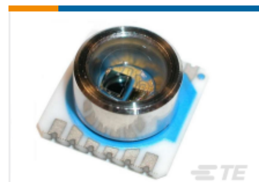
TE 产品编号325534009-50 1 BAR ALTIMETER PRESSURE SENSOR W GEL