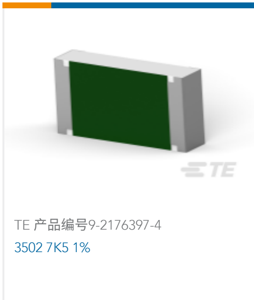
TE 产品编号9-2176397-4 3502 7K5 1%