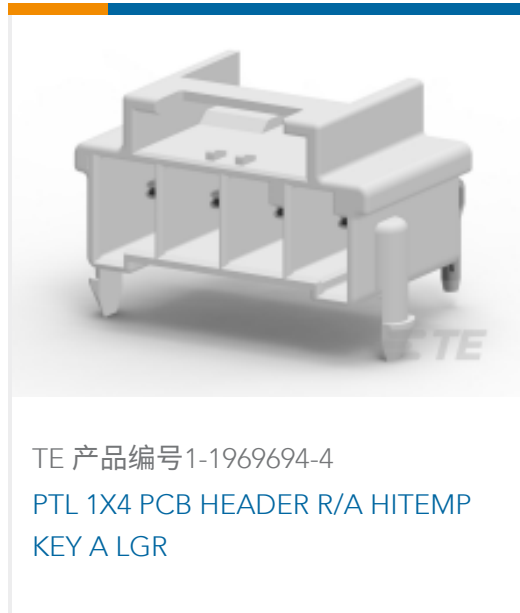
TE 产品编号1-1969694-4 PTL 1X4 PCB HEADER R/A HITEMP KEY A LGR