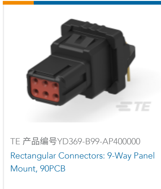
TE 产品编号YD369-B99-AP400000 Rectangular Connectors: 9-Way Panel Mount, 90PCB