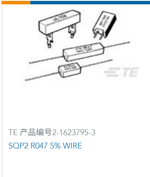
TE 产品编号2-1623795-3 SQP2 R047 5% WIRE