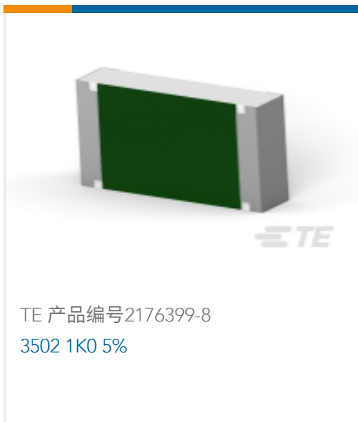
TE 产品编号2176399-8 3502 1K0 5%