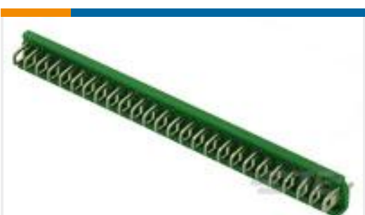
TE 产品编号5164713-7 07P.MINI-MATCH ASSY