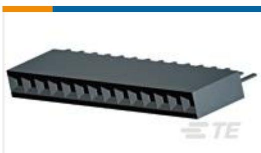
TE 产品编号6-534237-2 14 MODII VRT SR CE 100/115