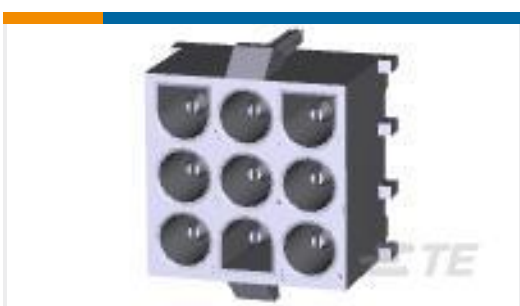
TE 产品编号641972-3 09P UMNL PIN HDR ASSY 94VO LF