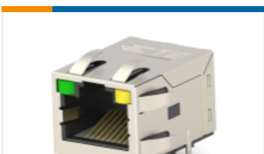
TE 产品编号5-2337992-3 RJ45 JACK MAG. POE 10/100 LED 1X1 INV.