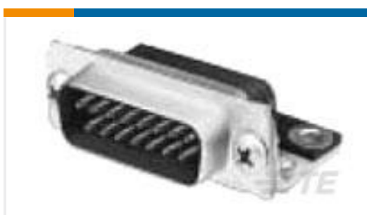
TE 产品编号5745435-8 15 PLUG RA/MS 454