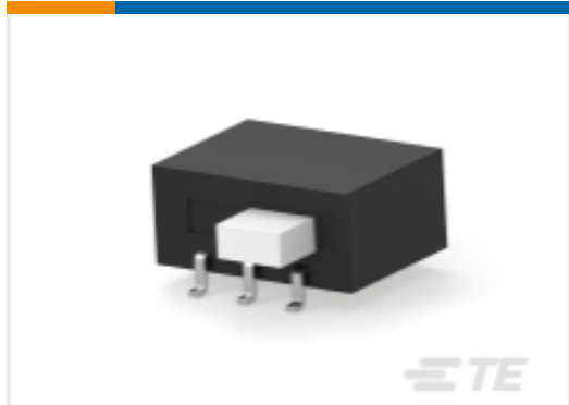
TE 产品编号1-1437581-1 ASE22RL=AUTOSLIDE DP