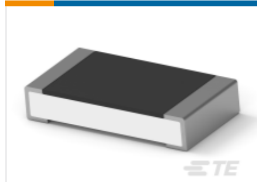
TE 产品编号4-2176391-7 RQ 1206 37K4 0.1% 10PPM 5K RL