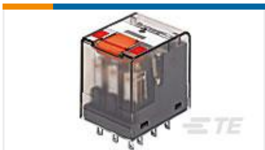
TE 产品编号3-1415020-1 PT570N20