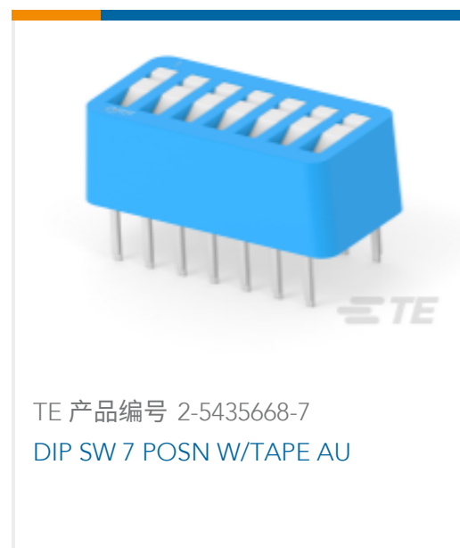
TE 产品编号 2-5435668-7 DIP SW 7 POSN W/TAPE AU