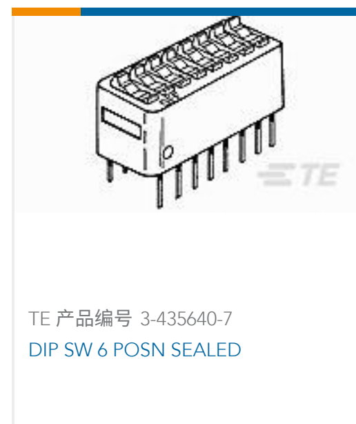
TE 产品编号 3-435640-7 DIP SW 6 POSN SEALED