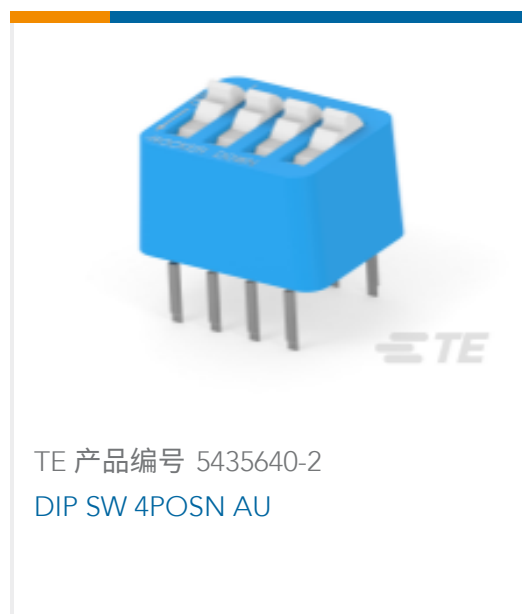
TE 产品编号 5435640-2 DIP SW 4POSN AU