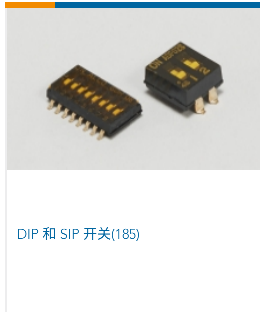
DIP 和 SIP 开关(185)