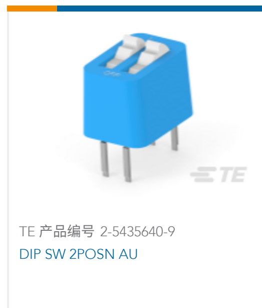
TE 产品编号 2-5435640-9 DIP SW 2POSN AU