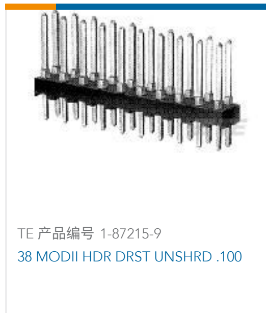
TE 产品编号 1-87215-9 38 MODII HDR DRST UNSHRD .100