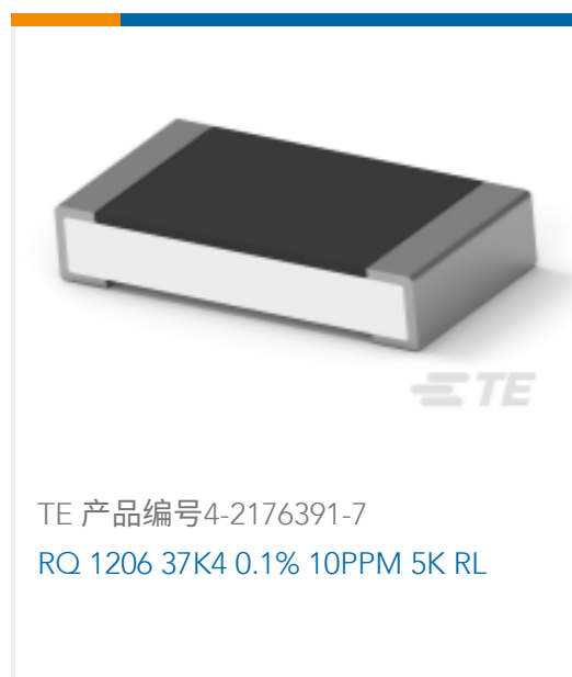
TE 产品编号4-2176391-7 RQ 1206 37K4 0.1% 10PPM 5K RL