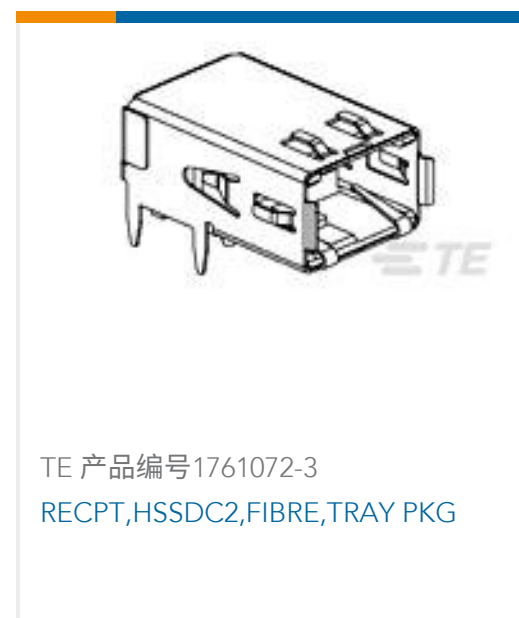
TE 产品编号1761072-3 RECPT,HSSDC2,FIBRE,TRAY PKG