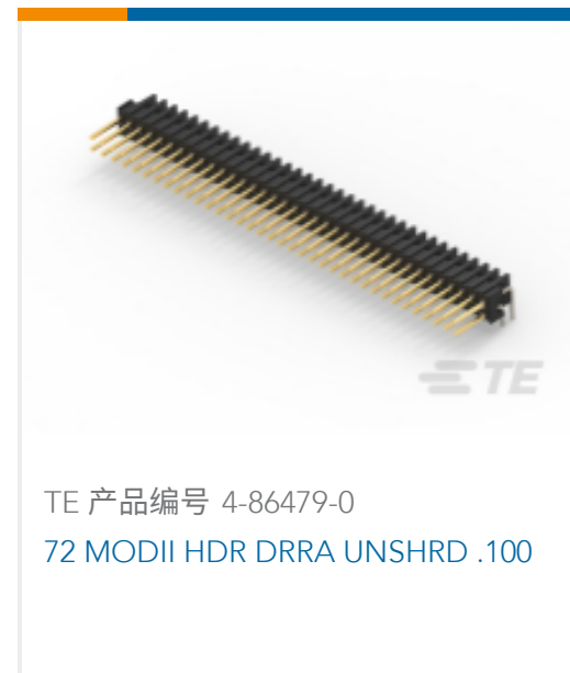
TE 产品编号 4-86479-0 72 MODII HDR DRRA UNSHRD .100