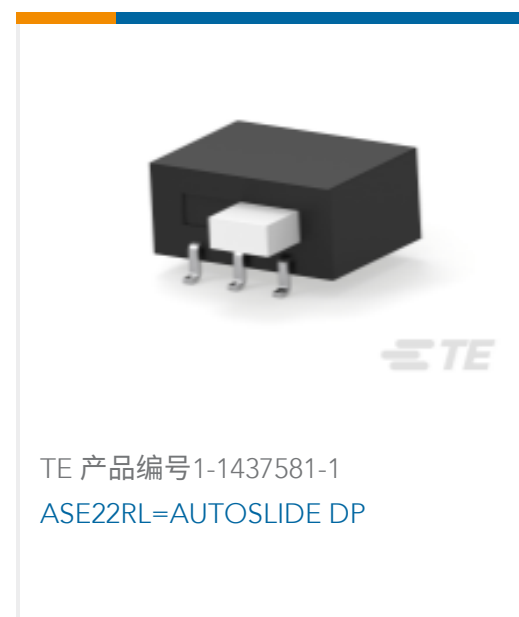
TE 产品编号1-1437581-1 ASE22RL=AUTOSLIDE DP