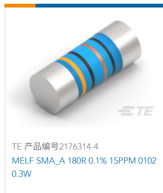
TE 产品编号2176314-4 MELF SMA_A 180R 0.1% 15PPM 0102 0.3W