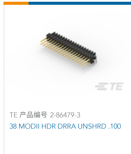
TE 产品编号 2-86479-3 38 MODII HDR DRRA UNSHRD .100