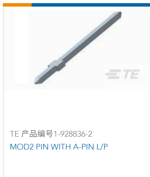
TE 产品编号1-928836-2 MOD2 PIN WITH A-PIN L/P