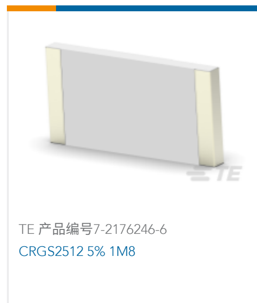
TE 产品编号7-2176246-6 CRGS2512 5% 1M8