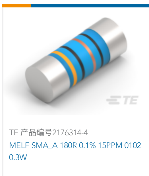
TE 产品编号2176314-4 MELF SMA_A 180R 0.1% 15PPM 0102 0.3W