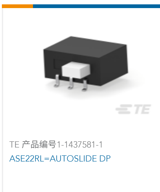
TE 产品编号1-1437581-1 ASE22RL=AUTOSLIDE DP 0.3W