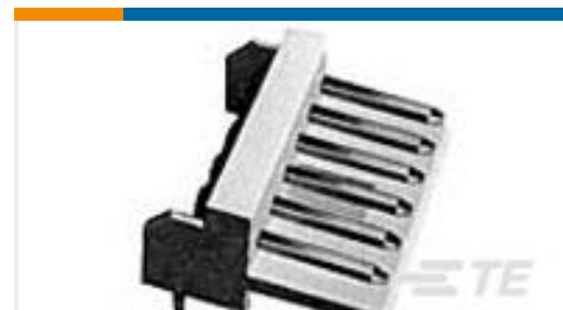
TE 产品编号176153-6 EIS POST HDR ASSY H 6P GOLD