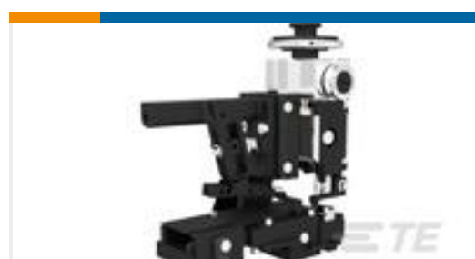
TE 产品编号2151147-1 OCEAN-2.0-APPLICATOR-S-042F042O-RSM