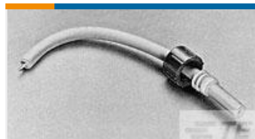
TE 产品编号846290-4 LGH-4 SGL MOLDED END LEAD