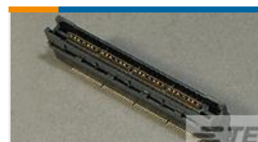
TE 产品编号5767094-4 MICT,RECPT,152,ASY,PDNI,EXTD