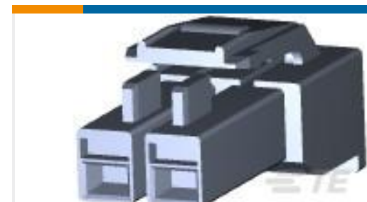
TE 产品编号176271-2 AMP UNIVERSAL POWER PLUG 2P