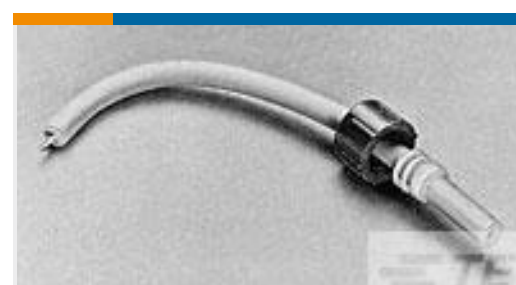
TE 产品编号4-846290-4 LGH-4 SGL ENDED LEAD, 4 FT.