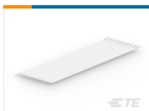
TE 产品编号7-1437142-5 FSN-22A-9=NOMEX FS STD