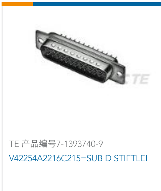
TE 产品编号7-1393740-9 V42254A2216C215=SUB D STIFTLI