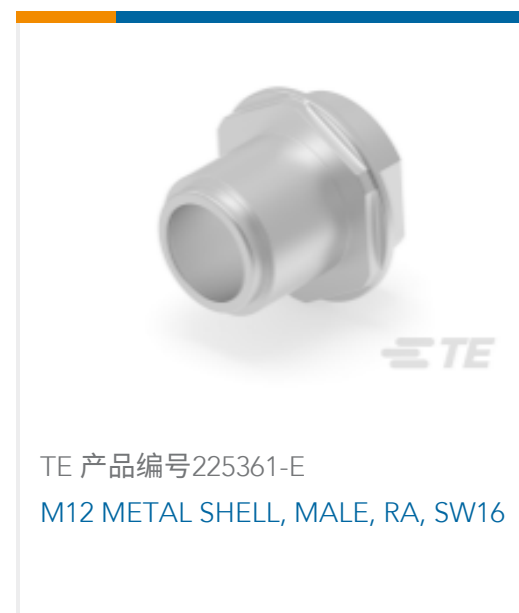
TE 产品编号225361-E M12 METAL SHELL, MALE, RA, SW16