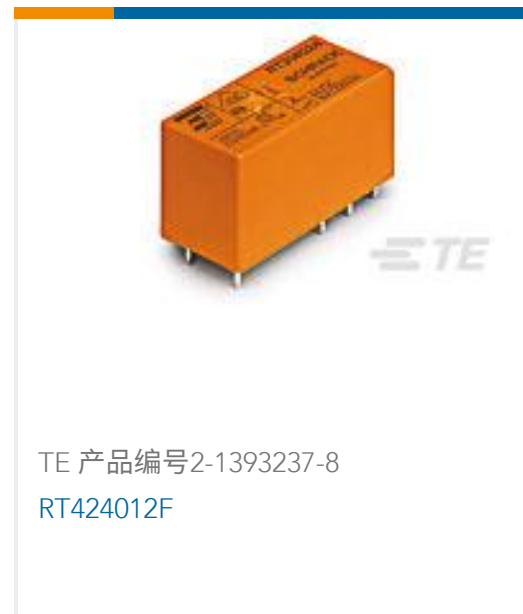
TE 产品编号2-1393237-8 RT424012F