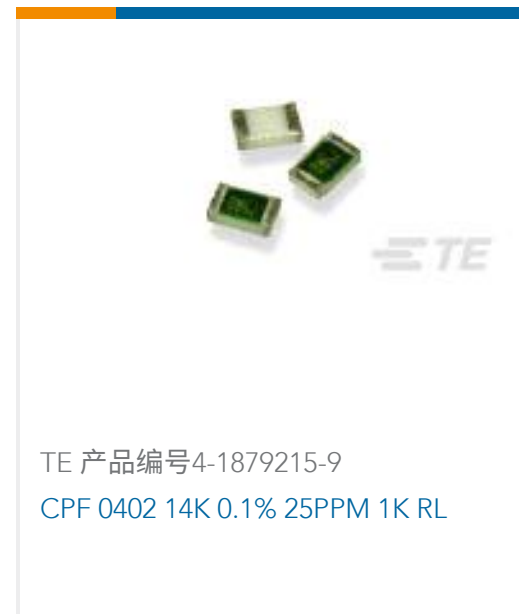
TE 产品编号4-1879215-9 CPF 0402 14K 0.1% 25PPM 1K RL