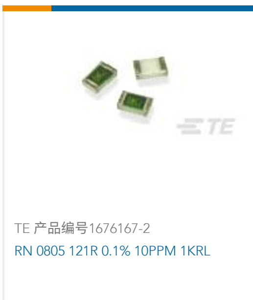
TE 产品编号1676167-2 RN 0805 121R 0.1% 10PPM 1KRL