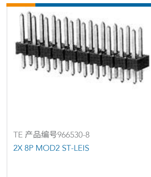
TE 产品编号966530-8 2X 8P MOD2 ST-LEIS