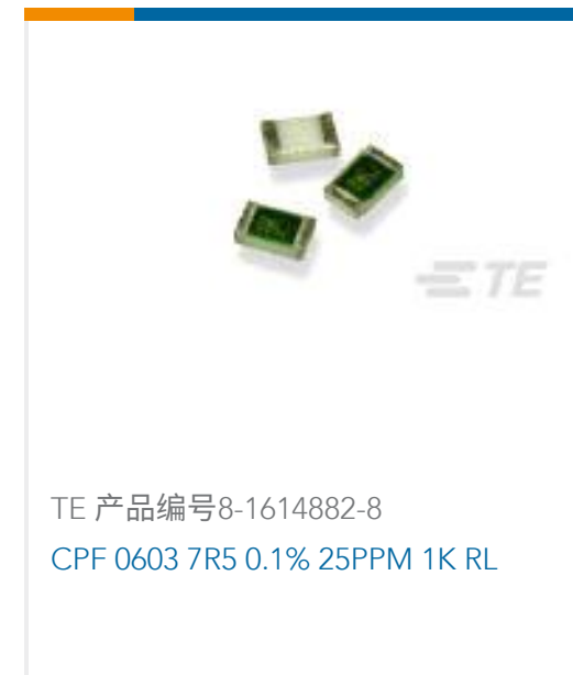
TE 产品编号8-1614882-8 CPF 0603 7R5 0.1% 25PPM 1K RL