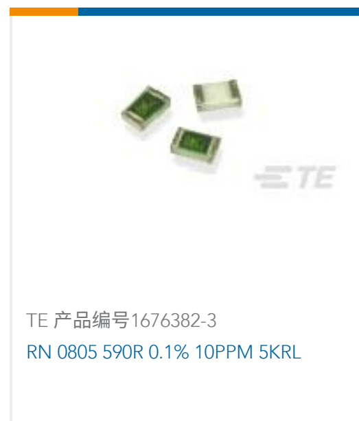
TE 产品编号1676382-3 RN 0805 590R 0.1% 10PPM 5KRL