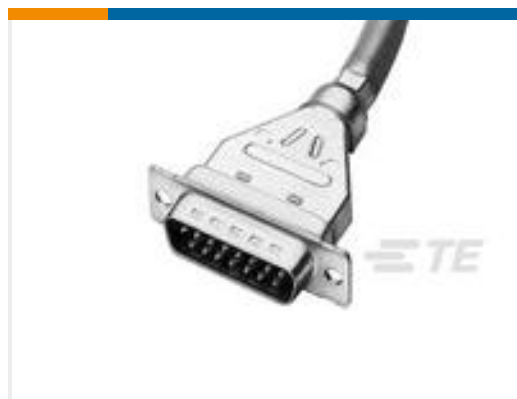
TE 产品编号1658652-1 KIT, HDP-20, OVRMLD, PLUG, SIZE 5,