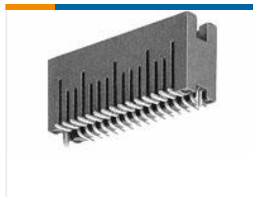
TE 产品编号5-104693-5 50 50/50 HDR DRST SFMNT.390 SN