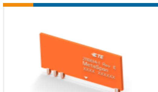
TE 产品编号2118614-1 ANTENNA, LTE, METASPAN, PCB, TAB MOUNT