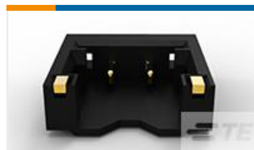
TE 产品编号1909782-4 BOARD TO WIRE WAFER 1.2MM TOP ENTRY