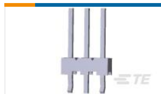
TE 产品编号644886-3 03P MTA100 HDR ASSY,NARROW AU