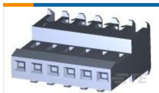
TE 产品编号3-641311-6 06 CIR MTA-100 ASSY TAPE LF