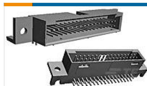
TE 产品编号1-87813-4 34 MODII HDR DRRR SHRD .100CL