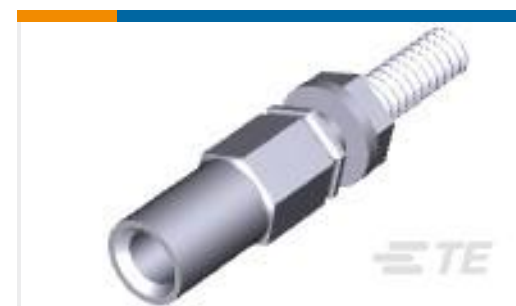
TE 产品编号200875-8 SERIES "M" JACKSCREW SOCKET AS