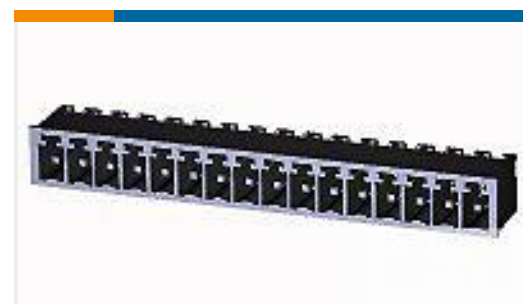
TE 产品编号796694-5 5 POS TERMI-BLOK HDR DIR. POL.