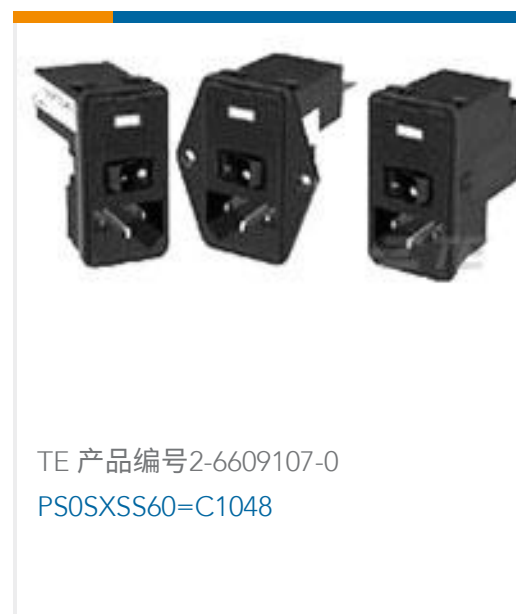
TE 产品编号2-6609107-0 PS0SXSS60=C1048