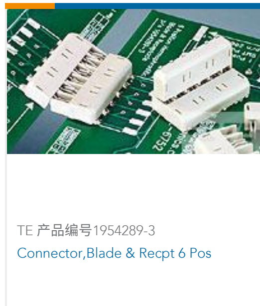
TE 产品编号1954289-3 Connector, Blade & Recept 6 Pos