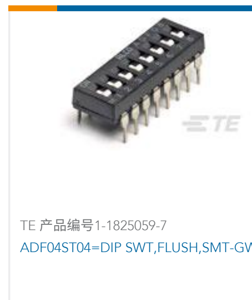
TE 产品编号1-1825059-7 ADF04ST04=DIP SWT, FLUSH, SMT-GW