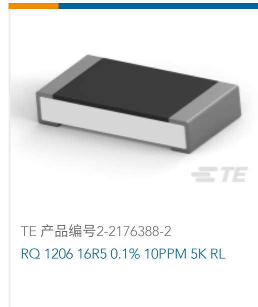
TE 产品编号2-2176388-2 RQ 1206 16R5 0.1% 10PPM 5K RL