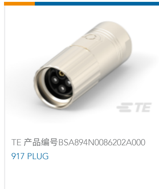
TE 产品编号BSA894N0086202A000 917 PLUG