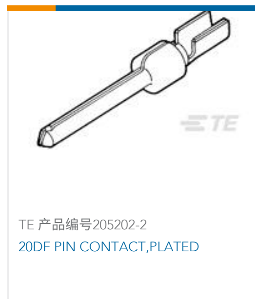
TE 产品编号205202-2 20DF PIN CONTACT, PLATED