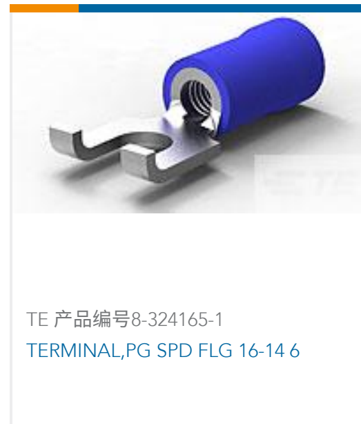
TE 产品编号8-324165-1 TERMINAL, PG SPD FLG 16-14 6