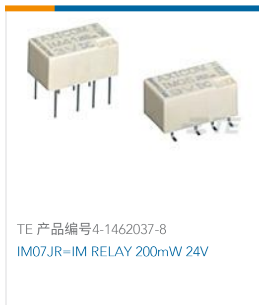
TE 产品编号4-1462037-8 IM07JR=IM RELAY 200mW 24V