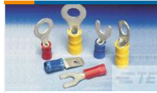
TE 产品编号322313 TERMINAL,PI FLAG R 16-14HD 14