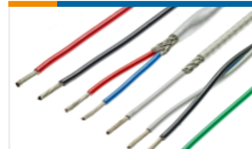
TE 产品编号A956573001 FLDWC0311-1.50-2