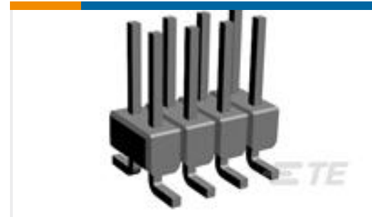
TE 产品编号1241050-4 2x4P MOD II BREAK AWAY HDR,SMD, BLISTER