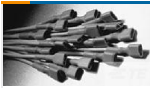
TE 产品编号4329854002 LSTT-2.4-9-SP