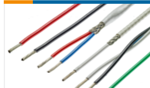
TE 产品编号CQ93033001 FLDWC0311-1.00-0CK0202/1