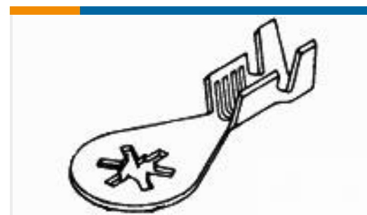
TE 产品编号350436-2 RING TERMINAL 18-14 AWG TPST