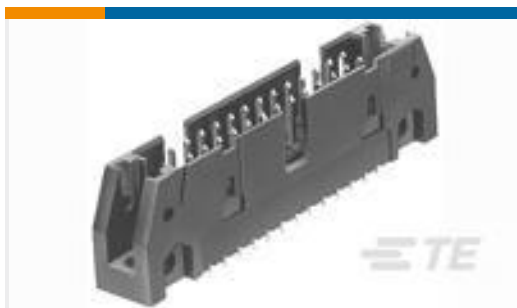
TE 产品编号5102154-2 A/L UNIV HDR 14P VERT