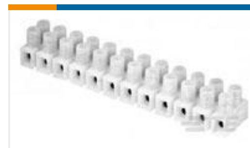
TE 产品编号1776293-1 TSB23001DS=EUROPA TERM BLK, 8MM