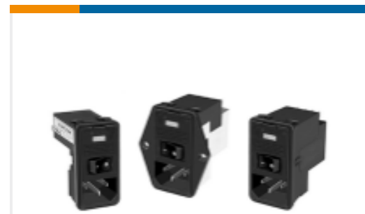
TE 产品编号3-6609107-3 CORCOM P 系列多功能插口式滤波器