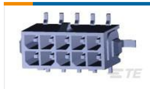
TE 产品编号4-794638-0 10P MICRO MNL ASSY,VRT,SMT,LF