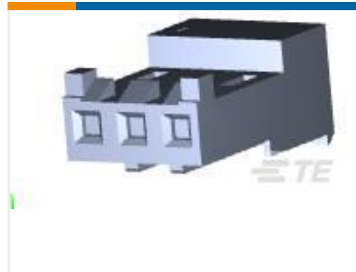
TE 产品编号3-643818-3 03P MTA156 CONN ASSY 20AWG YEL