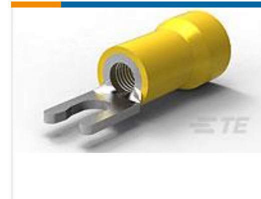
TE 产品编号52961-1 TERMINAL,PG SPR SPD 12-10 6