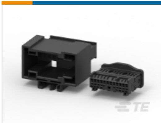
TE 产品编号1-1418463-9 MOS 连接器外壳