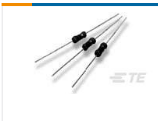
TE 产品编号2-1879353-1 RR02 5% 30K AMMO