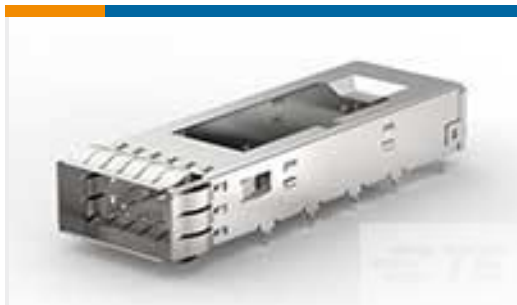
TE 产品编号2170703-7 CAGE ASSEMBLY, QSFP28 1X1, SPRING