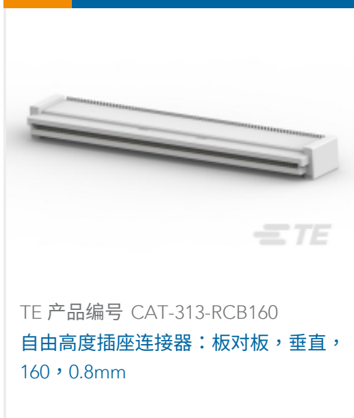
TE 产品编号 CAT-313-RCB160 自由高度插座连接器：板对板，垂直，160，0.8mm