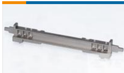
TE 产品编号2057592-2 CFP Guide Rail