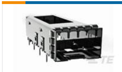
TE 产品编号2170261-1 SFP+ Enhanced 1x1 Cage Assembly