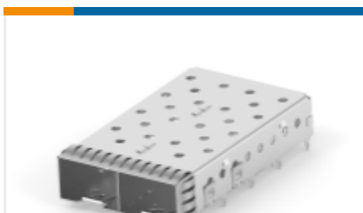
TE 产品编号2007263-3 SFP+ 1x2 Cage Assembly