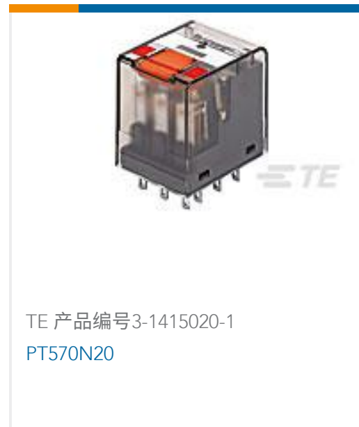
TE 产品编号3-1415020-1 PT570N20