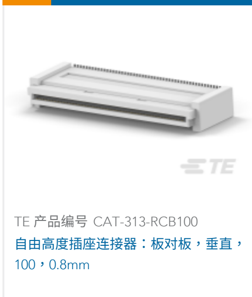
TE 产品编号 CAT-313-RCB100 自由高度插座连接器：板对板，垂直，100，0.8mm