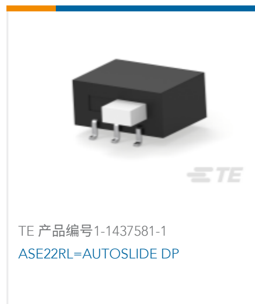
TE 产品编号1-1437581-1 ASE22RL=AUTOSLIDE DP