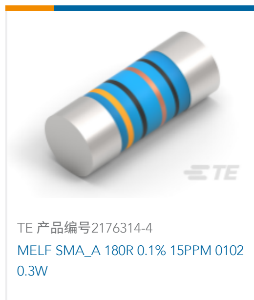
TE 产品编号2176314-4 MELF SMA_A 180R 0.1% 15PPM 0102 0.3W