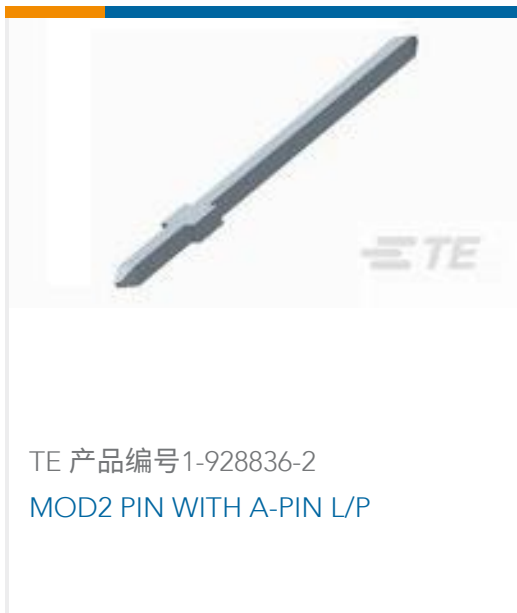
TE 产品编号1-928836-2 MOD2 PIN WITH A-PIN L/P