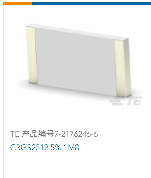
TE 产品编号7-2176246-6 CRGS2512 5% 1M8