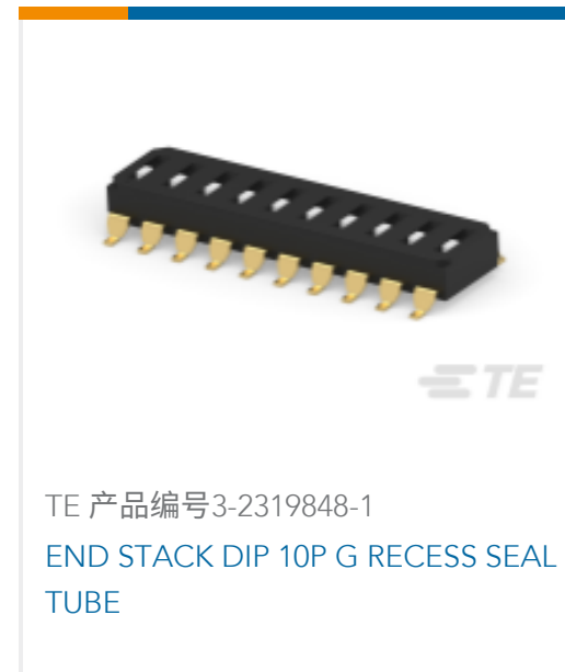
TE 产品编号3-2319848-1 END STACK DIP 10P G RECESS SEAL TUBE