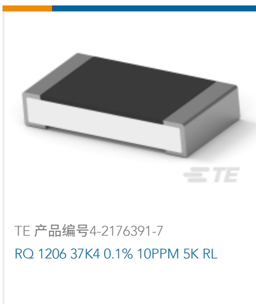
TE 产品编号4-2176391-7 RQ 1206 37K4 0.1% 10PPM 5K RL