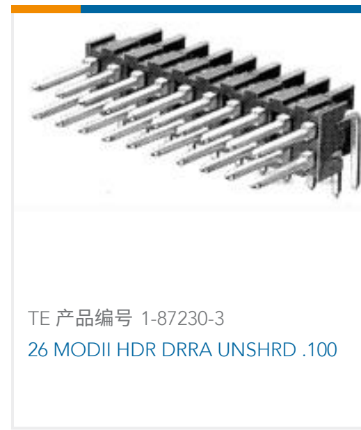
TE 产品编号 1-87230-3 26 MODII HDR DRRA UNSHRD .100