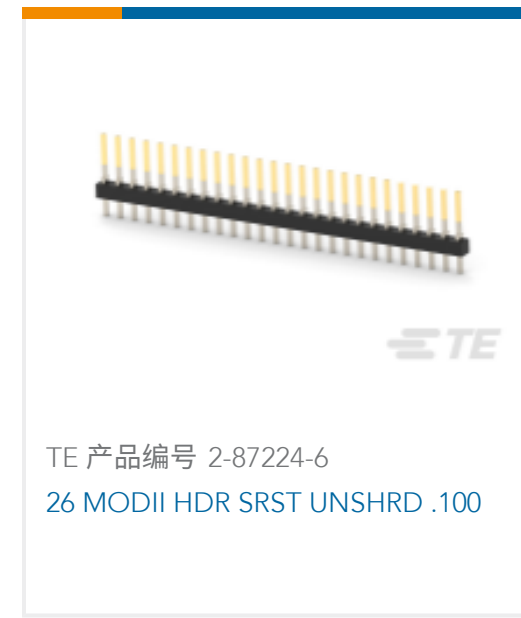
TE 产品编号 2-87224-6 26 MODII HDR SRST UNSHRD .100