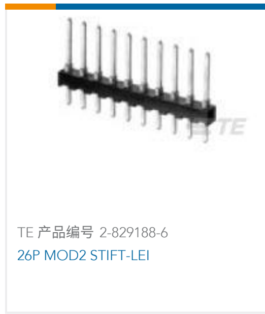
TE 产品编号 2-829188-6 26P MOD2 STIFT-LEI