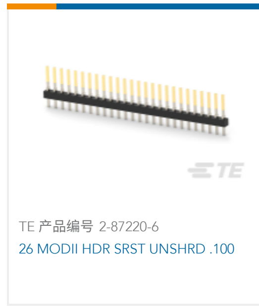
TE 产品编号 2-87220-6 26 MODII HDR SRST UNSHRD .100