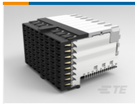
TE 产品编号2198264-3 SW 360, 8X8, 4.5, SN