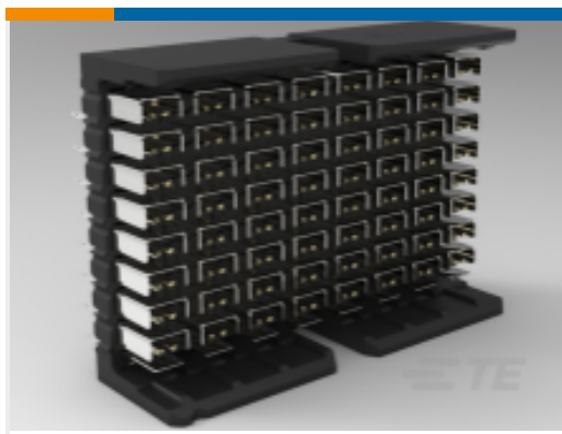
TE 产品编号2180824-5 SW, HDR, 8x8, Thick, Sn