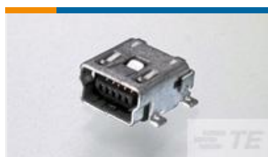
TE 产品编号1734035-3 MINI USB, TYPE B, R/A, SMT