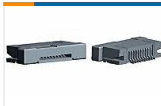
TE 产品编号1-1734592-3 FPC CONN. 0.5MM PITCH B/C, 13P