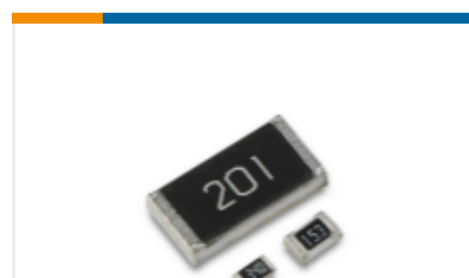
TE 产品编号2-2176326-7 CRGP 0603 1K5 1%