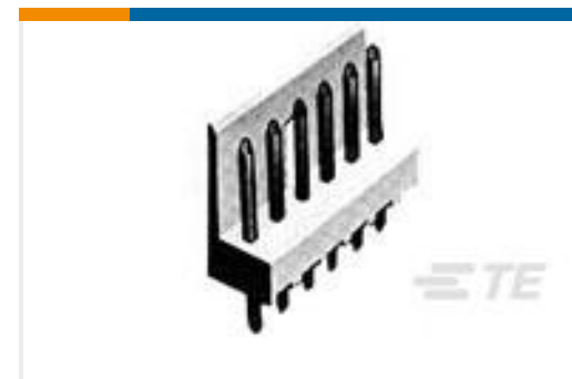
TE 产品编号172732-4 POST HEADER 4P EIS WITH KINK