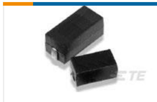
TE 产品编号2-1879233-5 SMW5 1R0 5%