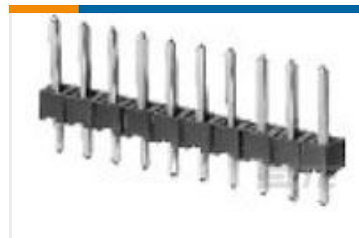
TE 产品编号5-146281-2 02 MODII HDR SRST B/A LF