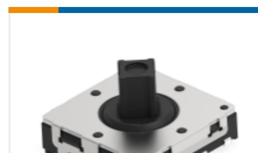
TE 产品编号2425755-1 5 position tactile, 12x12