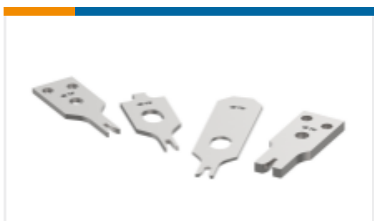
TE 产品编号3-1803454-9 CRIMPER,WIRE F