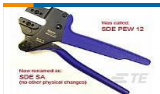
TE 产品编号2063583-1 SDE HN.D HVT HE/HA 0.13-4.0mm2 ASSY