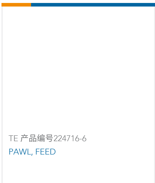
TE 产品编号224716-6 PAWL, FEED