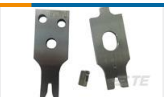
TE 产品编号7-2151320-7 OCEAN_2.0_SPARE_PART_KIT- 100F190O180F