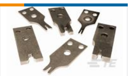
TE 产品编号1633964-3 CRIMPER, INSULATION OVERLAP PREM