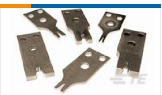
TE 产品编号1-1633860-5 CRIMPER, WIRE F