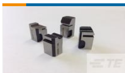
TE 产品编号462006-6 FLOATING SHEAR