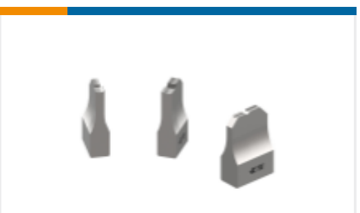
TE 产品编号9-1803054-3 ANVIL, COMBINATION