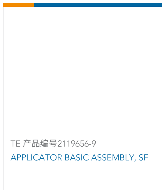
TE 产品编号2119656-9 APPLICATOR BASIC ASSEMBLY, SF