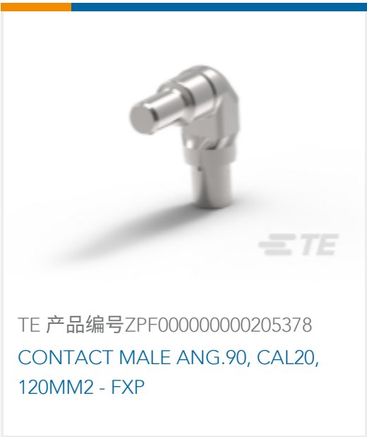
TE 产品编号ZPF000000000205378 CONTACT MALE ANG.90, CAL20, 120MM2 - FXP