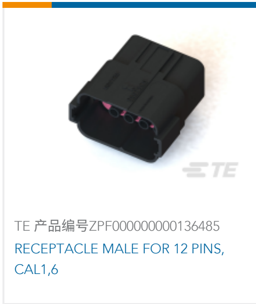
TE 产品编号ZPF000000000136485 RECEPTACLE MALE FOR 12 PINS, CAL1,6