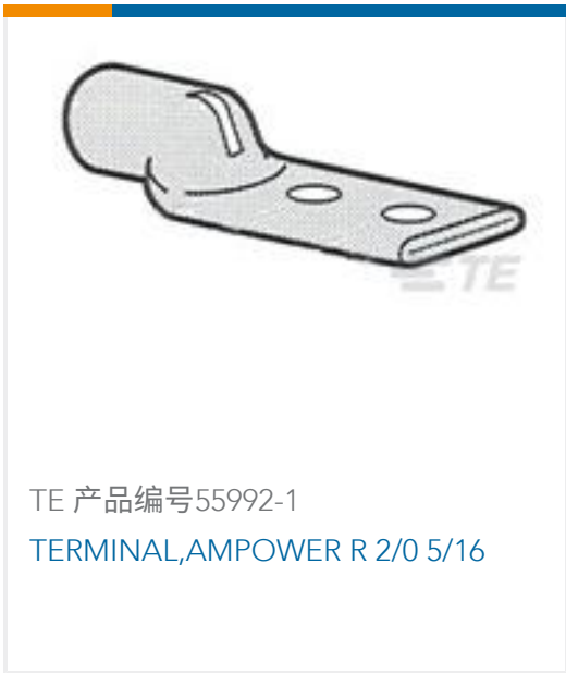
TE 产品编号55992-1 TERMINAL, AMPPOWER R 2/0 5/16