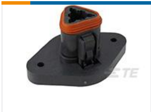
TE 产品编号DT06-3S-CL08 PLG, 3P, BLK, E, FLANGE CAP