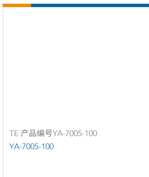
TE 产品编号YA-7005-100 YA-7005-100