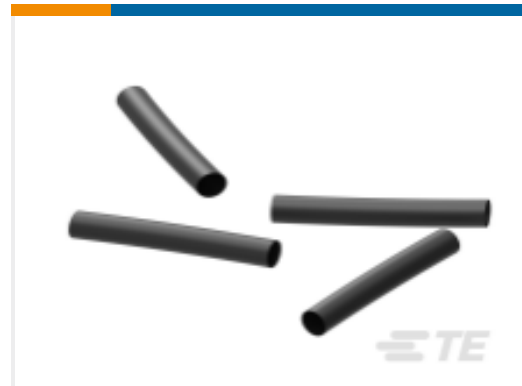
TE 产品编号EK5194-000 ES2000-NO.6-H2-0-39MM