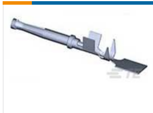
TE 产品编号1062-20-0322 SOC, SF, SIZE 20, 16-22, SLEWLESS, NI /NI