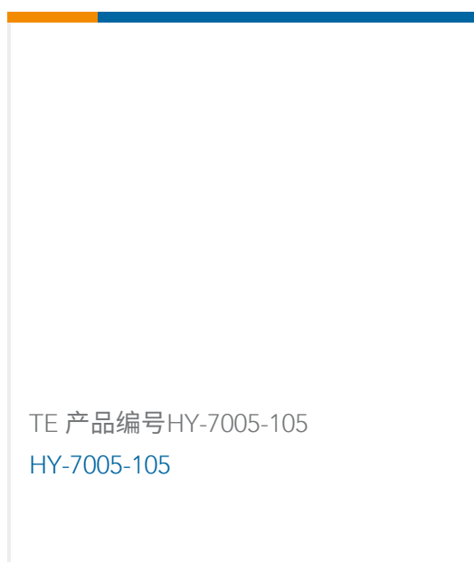
TE 产品编号HY-7005-105 HY-7005-105