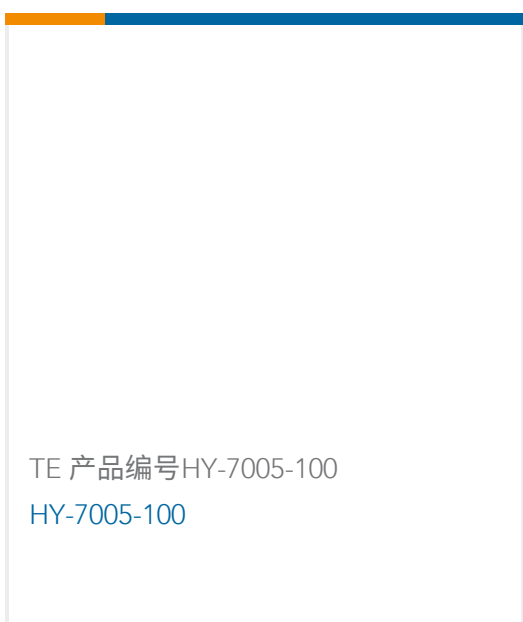
TE 产品编号HY-7005-100 HY-7005-100