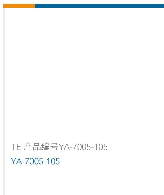
TE 产品编号YA-7005-105 YA-7005-105